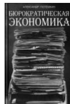
«Бюрократическая экономика», второе, дополненное издание