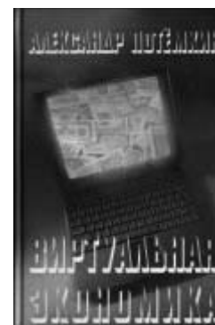
«Виртуальная экономика», второе, дополненное издание