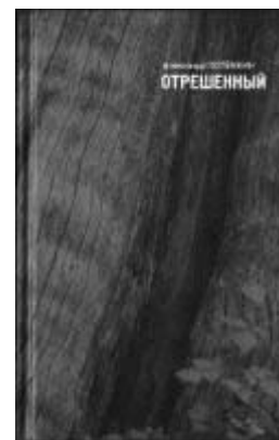
«Отрешенный», сборник рассказов