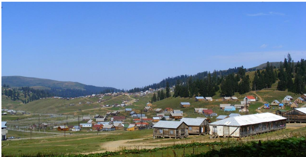
ნახ.1.1. კურორტ ბახმაროს დასახლებული ტერიტორია

კურორტი ბახმარო მაღალმთიანი კლიმატური კურორტია ჩოხატაურის მუნიციპალიტეტში, მდებარეობს მესხეთის ქედზე მდ. ბახვისწყლის ხეობაში, ტყის ზონის ზედა ნაწილში 1926-2050 მ-ის სიმაღლეზე და ითვლება ერთ-ერთ ყველაზე მაღალ დასახლებულ პუნქტად, ხასიათდება რთული რელიეფით. ტერიტორია ერთგვარ ქვაბულს წარმოადგენს და გარშემორტყმულია ნაძვისა და სოჭის ტყით. ბახმაროს რესპუბლიკური კურორტის სტატუსი 1922 წლიდან მიენიჭა (ნახ.1.1).