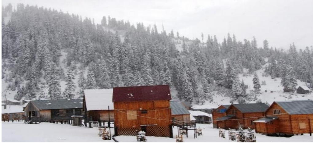
ნახ. 2.4.1. საშუალოთოვლიანი ზამთარი კურორტ ბახმაროში

იმ მონაცემების მიხედვით (1932-2006 წწ.) რომელიც მოგვეპოვება შეიძლება დავადგინოთ, რომ თოვლიან დღეთა რაოდენობა ბახმაროში საშუალოდ 189 დღეს შეადგენს, ხოლო მაქსიმუმი 231 დღეა დაფიქსირებული. თოვლის საფარი ოქტომბრიდან მაისამდეა. მდგრადი თოვლის საფარი საშუალოდ ნოემბრის მეორე დეკადაში აღინიშნება, ხოლო დნობა - მაისის მესამე დეკადაში (ნახ. 2.4.1).