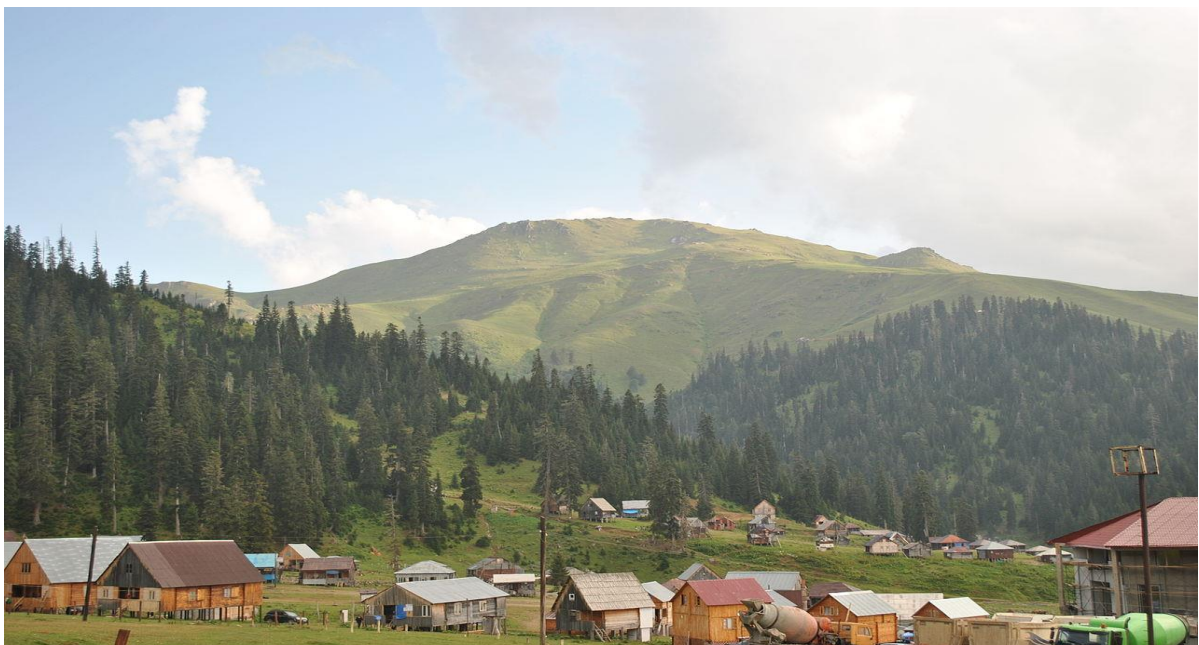
ნახ.1.1.3. მთა ლაშიფერდი (მესხეთის ქედის განშტოება)