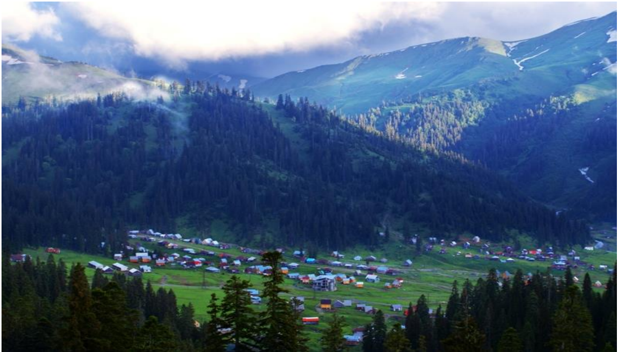
ნახ.1.1.1. მაღალმთიანი ქედებით შემოსაზღვრული კურორტი ბახმარო

კურორტი ბახმარო სამივე მხრიდან შემოსაზღვრულია მაღალმთიანი ქედებით: ჩრდილოეთიდან და აღმოსავლეთიდან მთა გადრეკილის განშტოებებით, სამხრეთიდან მესხეთის ქედის განშტოებებით, მხოლოდ ჩრდილო-დასავლეთიდან ესაზღვრება მდ. ბახვისწყლის ხეობის საშუალომთიანი ტერიტორია (ნახ. 1.1.1). კურორტ ბახმაროს ეს და სხვა სურათები ინტერნეტის საშუალებით არის მოპოვებული.