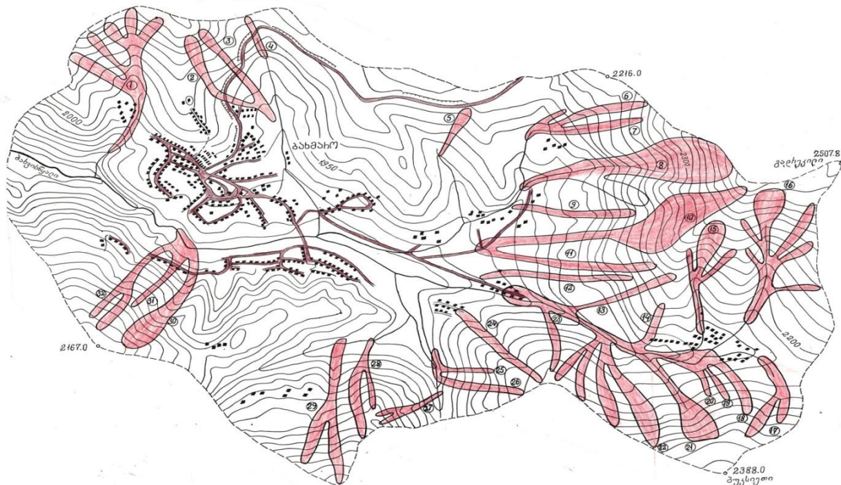
ნახ.4.2.1. კურორტ ბახმაროს ზვავშემკრების სქემატური რუკა

კურორტ ბახმაროს მიდამოებში შეიმჩნევა ზვავების ჩამოსვლა 32 ზვავის კერიდან. დანართის ცხრილში 1, 32 ზვავშემკრების ადგილმდებარეობაა მითითებული შესაბამისი ნომრით, მოცემულია ზვავშემკრების აბსოლუტური და შეფარდებითი სიმაღლე, ზვავშემკრების ცალკეული მონაკვეთების სიგრძე (გრაფა 2-7) (მორფომეტრიული მახასიათებლები), მითითებულია ზვავის კერის ფართობი (გრაფა 8), ფერდობის დახრილობა, აქვე აღენიშნავთ, რომ (2-7) და (9-11) გრაფაში ზემოთდასახელებული მახასიათებლები გამოთვლილია ზვავშემკრების სხვადასხვა წერტილისთვის, ხოლო ზვავის დინამიკური მახასიათებლები (მოძრაობის სიჩქარე, დარტყმის ძალა, მოძრავი ზვავის თოვლის სიმაღლე, მოცულობა) გამოთვლილია ზვავის გაჩერების ადგილისათვის. 1 გრაფაში, დაშტრიხული დახრილი ნუმერაცია მიუთითებს იმ ადგილზე სადაც გაივლის და ჩერდება ზვავი. ბოლოს კი მითითებულია ზვავის გადაადგილებისა თუ გაჩერების ადგილი. რუკაზე (ნახ.4.2.1) დატანილია ყველა ზვავშემკრები მათი გავრცელების საზღვრებით [10,11].