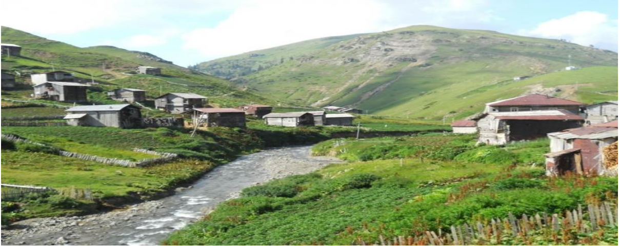
ნახ.12.1. სუბალპური და ალპური ზონა კურორტ ბახმაროში

კურორტ ბახმაროს ტერიტორიის მცენარეული საფარი ხასიათდება ტყის ფორმაციების მრავალფეროვნებითა და ტიპოლოგიური შემადგენლობის სიმდიდრით. ბუნებრივი ტყის საფარი 2000-2200 მეტრამდე ვცვლდება. ტყის ზემოთ სუბალპური ზონა გვხვდება ცალკეული ხეებით და სუბალპური მცენარეული საფარით; სუბალპური ზონის ზემოთ ალპური ზონაა ალპური მდელოებით. სუბალპურ და ალპურ ზონას დიდი ფართობი უჭირავს, რადგან ტერიტორიის უმეტესი ნაწილი მაღალმთიან რაიონში მდებარეობს (ნახ.12.1)