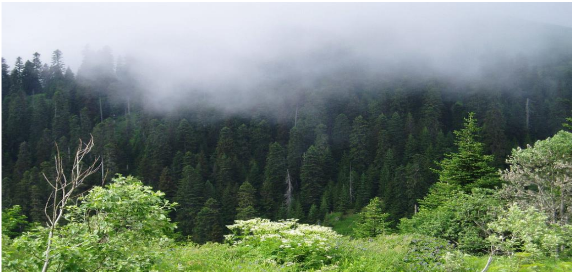
ნახ.12.2. წიწვოვანი და შერეული ტყე კურორტის ტერიტორიაზე

ტერიტორიის თითქმის ნახევარი ბუნებრივი ტყის საფართობი დაფარულია, რომლის უმეტესი ნაწილი წიწვიანია, ძირითადად ნაძვის ხეები. გვხვდება შერეული ტყეებიც. ტყის ძირითადი სახეობაა: ნაძვი, ფიჭვი, წიფელა და სხვა (ნახ.12.2).