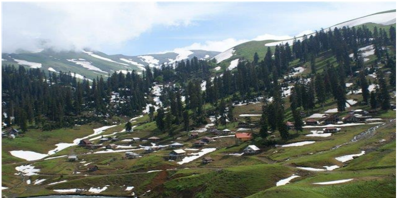
ნახ. 5.1. - 5.3. ზეაგშემკრებები კურორტ ბახმარის ტერიტორიაზე