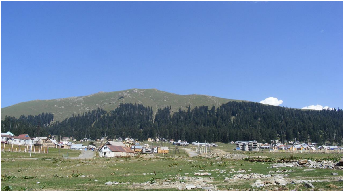
ნახ.1.1.2. მთა გადრეკილი, საიდანაც კარგად ჩანს მზის ამოსვლა

კურორტის ფერდობები ჩრდილოეთი, დასავლეთი და სამხრეთი ექსპოზიციისა, აქ აღმოსავლეთის ექსპოზიციის ფერდობები თითქმის არ გვხვდება.