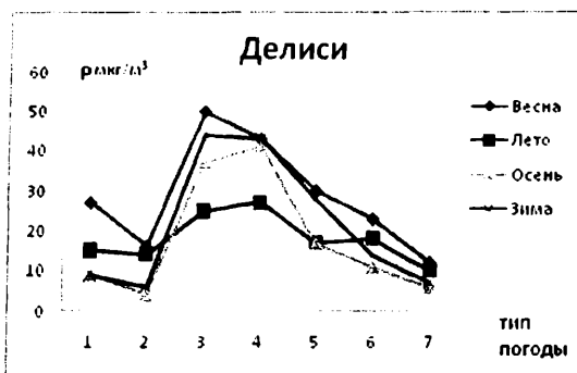
Рис.1 Изменение КПО для Тбилиси (Делиси)

На рис. 1 представлено изменение КПО во время всех четырёх сезонов для всех семи типов погоды для Тбилиси (Делиси). Как видно из этого рисунка, наибольшие значения КПО в Делиси наблюдаются весной, а самые низкие значения – осенью. Из этого рисунка видно также, что во время ясной, безоблачной погоды, КПО всегда выше, чем во время облачной погоды. Наибольшее значение КПО наблюдалось весной во время погоды третьего типа, когда среднее значение КПО достигает величины 50 \text{ мкг/м}^3 . Самое низкое значение КПО наблюдалось во время погоды второго типа и составляет величину порядка 4 \text{ мкг/м}^3 .