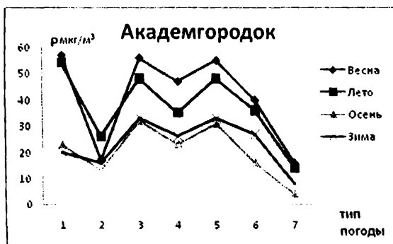
Рис.2 Изменение КПО для Тбилиси (Академгородок)

На рис.2 представлено изменение КПО во время всех четырёх сезонов для всех семи типов погоды для Тбилиси (Академгородок). Из этого рисунка видно, что во время всех семи типов погоды, наибольшее значение КПО наблюдается весной, а минимальные значения – осенью. Весной наибольшее значение КПО наблюдается во время погоды первого типа и составляет величину порядка 58 \text{ мкг/м}^3 , а наименьшее значение наблюдается во время погоды седьмого типа осенью и составляет 4 \text{ мкг/м}^3 .