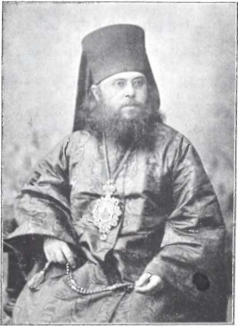
ეოვლად-სამღვდელო ღუთსიდე, ეპისკოპოსი თბილისა (იხ. ქვეით).