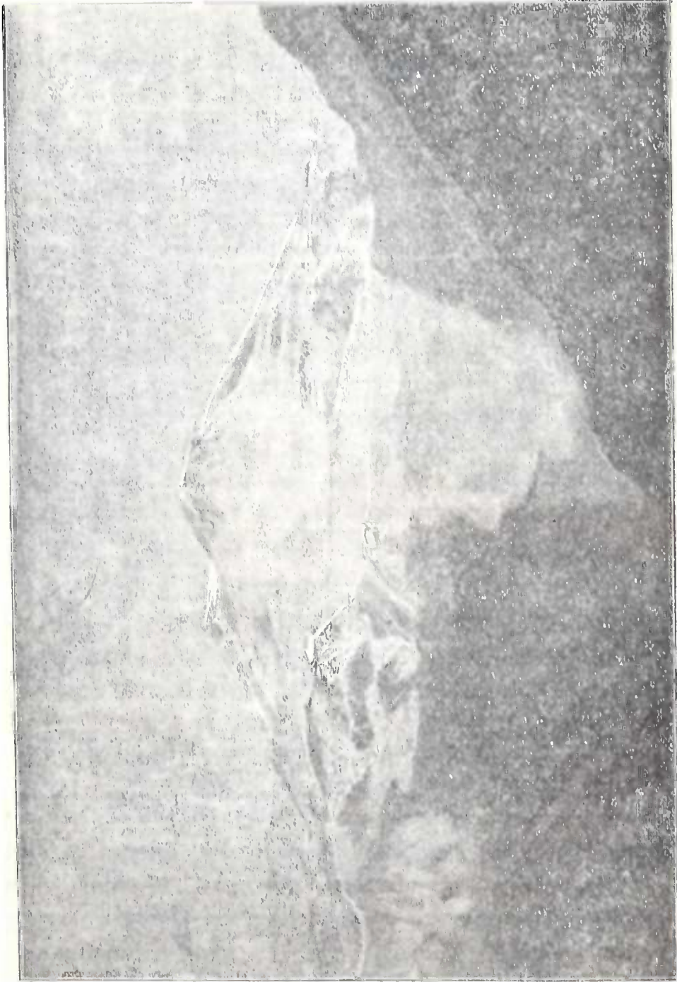
ბუმბერაზის ჩვეულებრივი მთებთან — აბაღუბი.