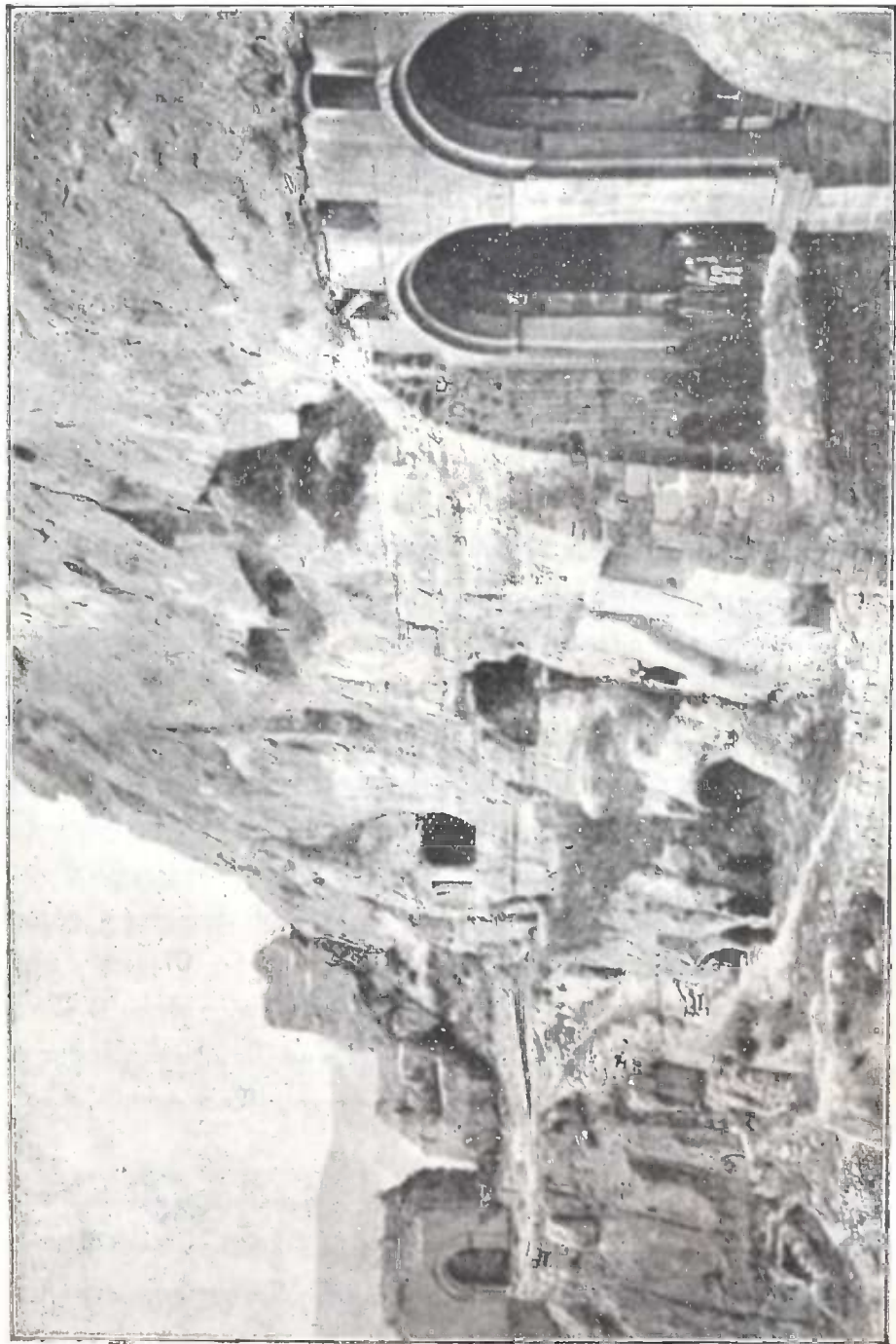
ვარიძის მონასტერი მესხეთში (ახალ-ციხის მარჯვნივ).