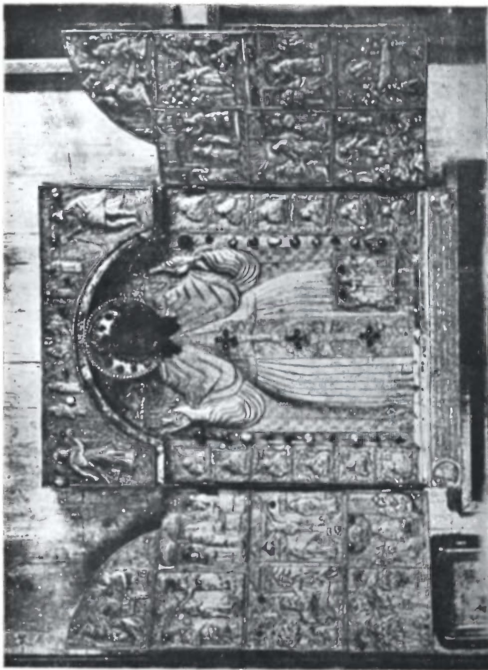
საბას კარელი ხატი, გუმლილი