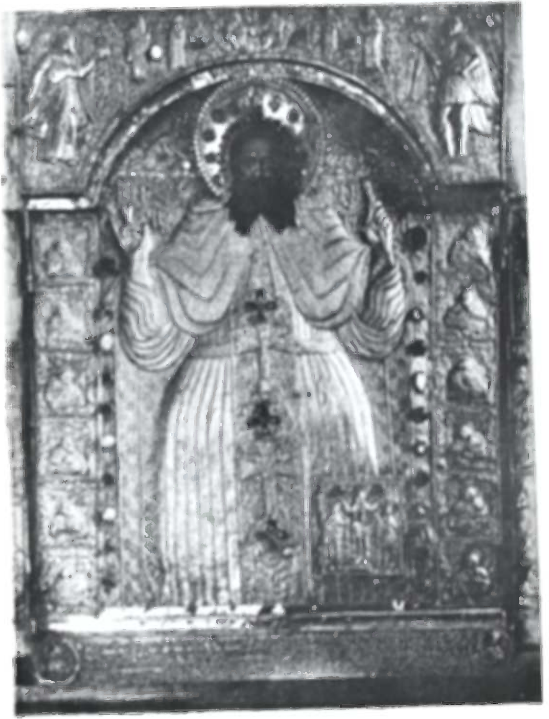
საბას კარელი ხატის შუა ნაწილი