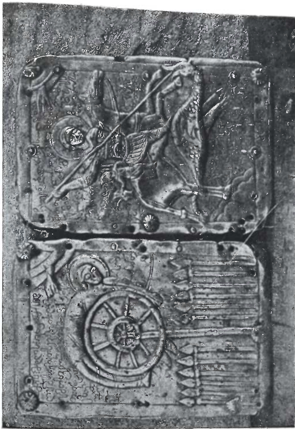
წმ. გიორგის მეტეფრასის ვერცხლის უღა