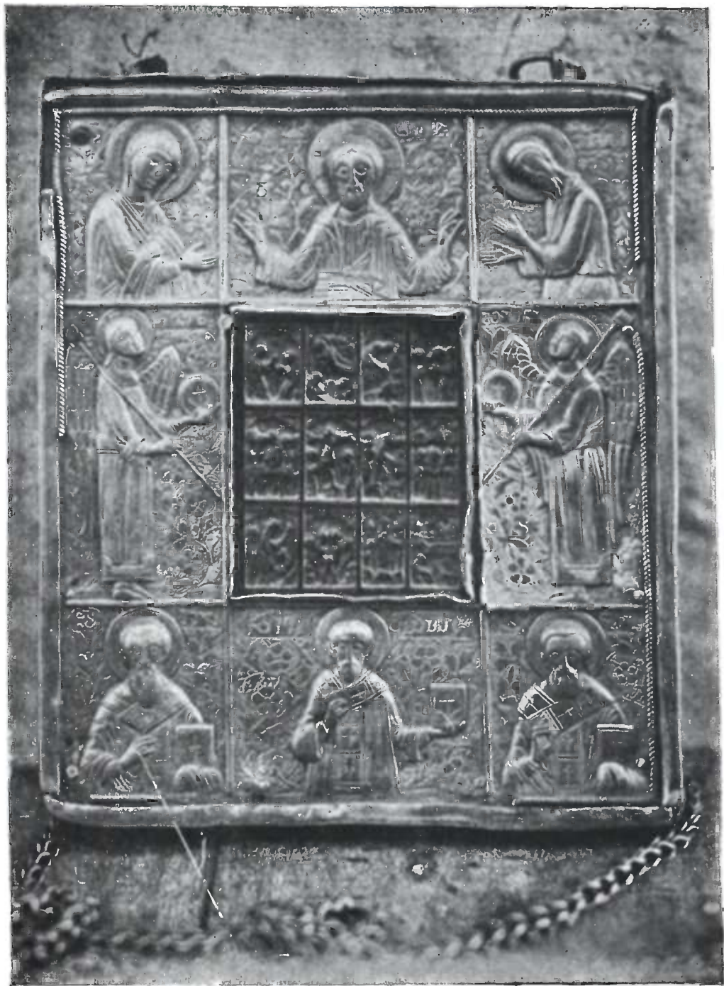
თორმეტი საუფლო ღვესასწაულის ხატი