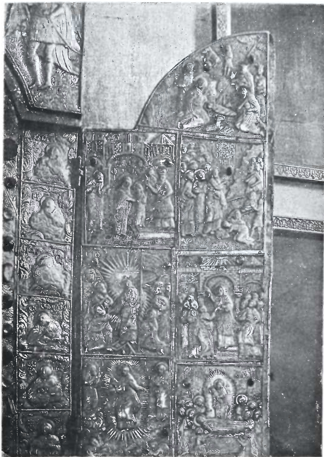
საბას კარელი ხეტი (მარჯვენა კარი)