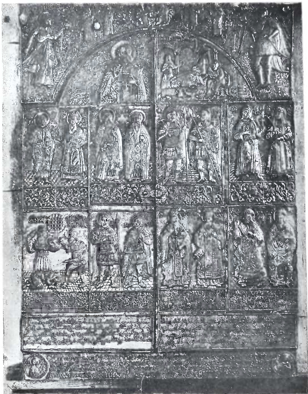
საბას კარელი ხატი, შუკეცილი