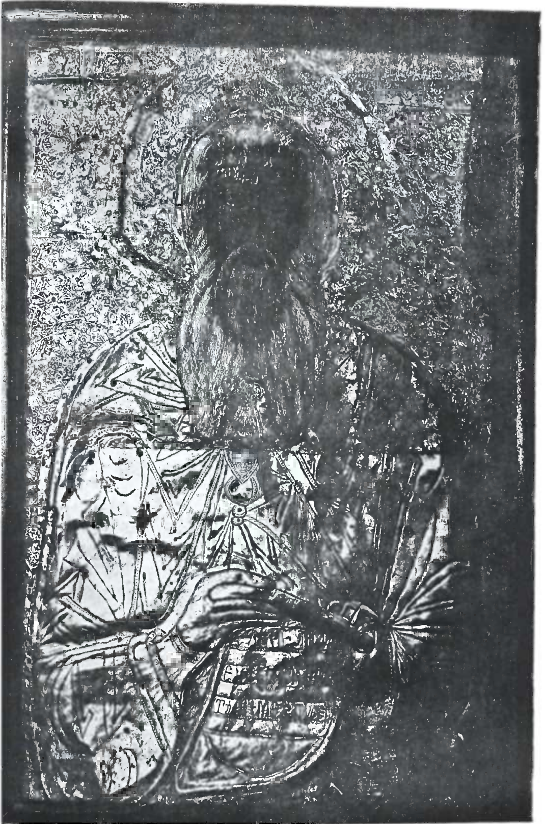
საბას მეორე ხატი