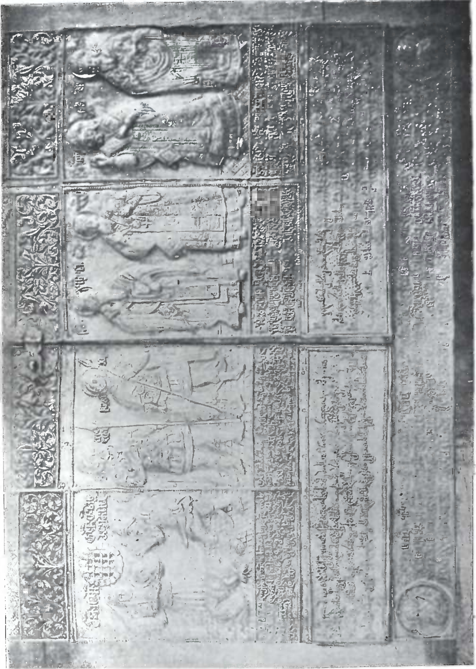
საბას კარელი ხატის წარწერები