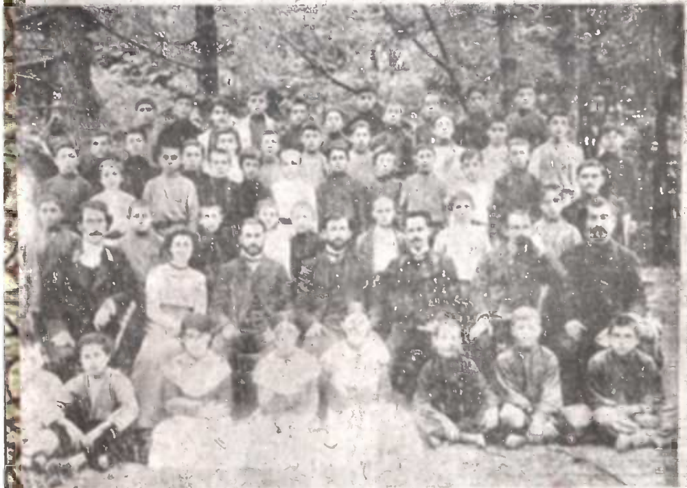
რის სახლობო სკოლების მასწავლებლების და მოწადეთა ექსკურსია