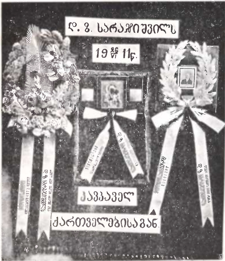
☛ კაკაველის ქართველების მიერ შირთმეული ვერცხლის გვირგვინები და ჩატი. განსვენებულს დ. ზ. სარაჯიშვილს დიდი ამაგი მიუძღვის კაკაველის ქართველთა შგვალა კულტურულ დაწესებულებაში