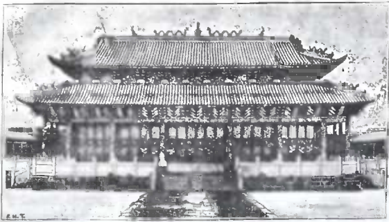
ზეცის ტაძარი ჩინეთში

კის დროს, თავადმა შეიტყო, რომ ხელმწი- | ძარბაგანი, აშენებული წინაშართა სხელ- ფის სასახლეში ელვას დაუწვავს ერთი ტა- | სედ. —