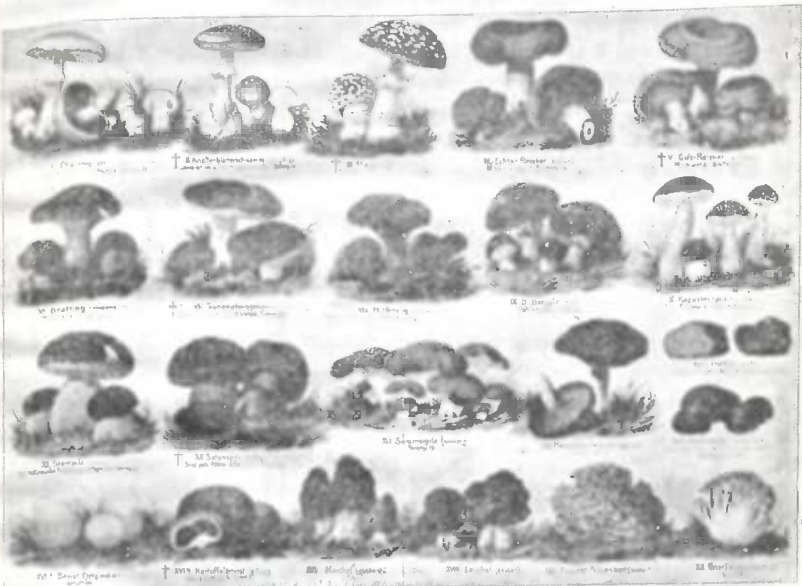
ის სოკოები, რომელთაც ვგარი უხის, შხამიანია.

დი ჰატარა მარცვადი (თესლი) ხვდება მდი- დარ სისუქნეში, ტუისა ან მინდვრის მიწის ზუადაზე, რომელიც შესდგება განცალკევებულ ბულ დამხალ მცენარეებისაგან და აქ, ამ ნა- უფთიერ მსუქან მიწაში, იზრდება (მრავლად დება); შირველად ხნდება რბილ ნაბადსავით