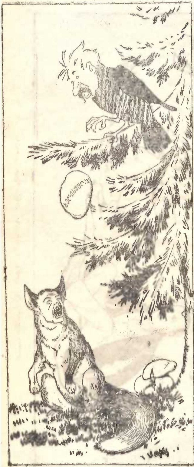
ყვეს გაუფარდა პირიდან ყველი და ჩიისველა მელიამ ყელი.