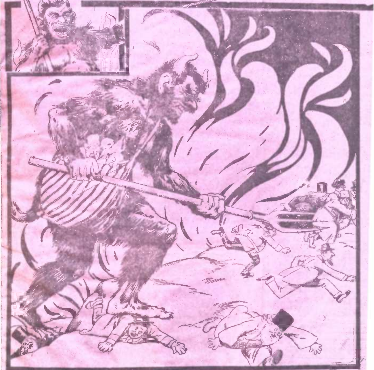
გარბიან ყველა: აზნაური, ჩარჩი, ხუცესი, მათი ნაბიჯი არის მათზე უფრო უგრძესი.