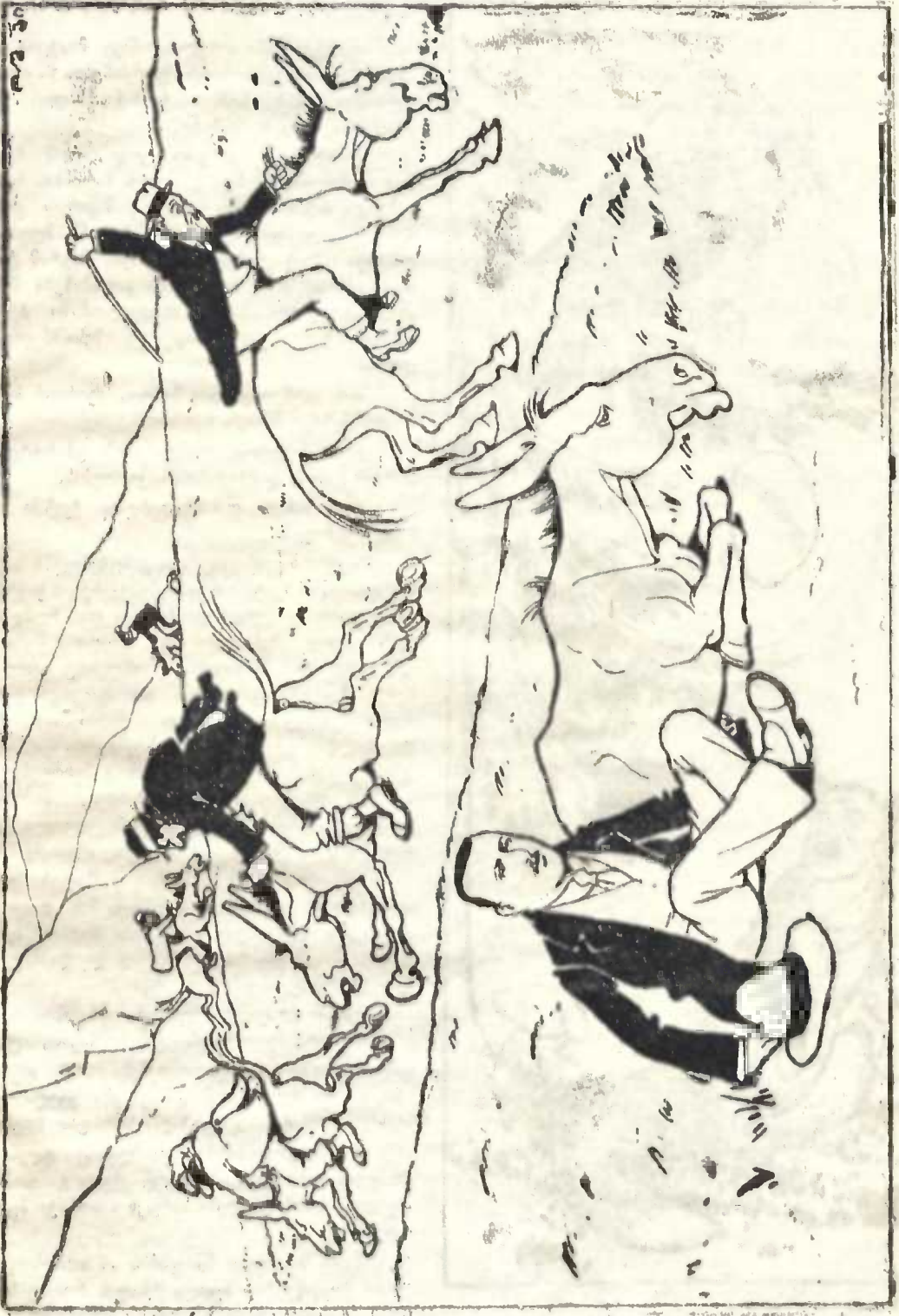
... զորքերն արդար անհրաժեշտ են հայրենիքին