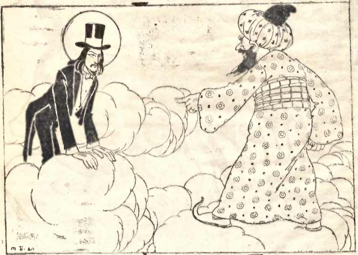
„ქრისტე იყო მენშევიკი, მაჰმადი კი ბოლშევიკი“

ჩვენ ვიცით ქრისტეს იგავი ვლახა ლაზარეზე, რომელიც მდიდართა სუფრის ნამცეცებით იყებებოდა. სამაგიეროთ სიკვდილის შემდეგ აბრამის წიალსა მინა იმყოფება. ასე არიან ეხლა მენშევიკებიც; კაპიტალისტების ნასუფრით იყებებიან, მაგრამ ლაზარესავით ნეტარნი იქნებიან საიქიოს.