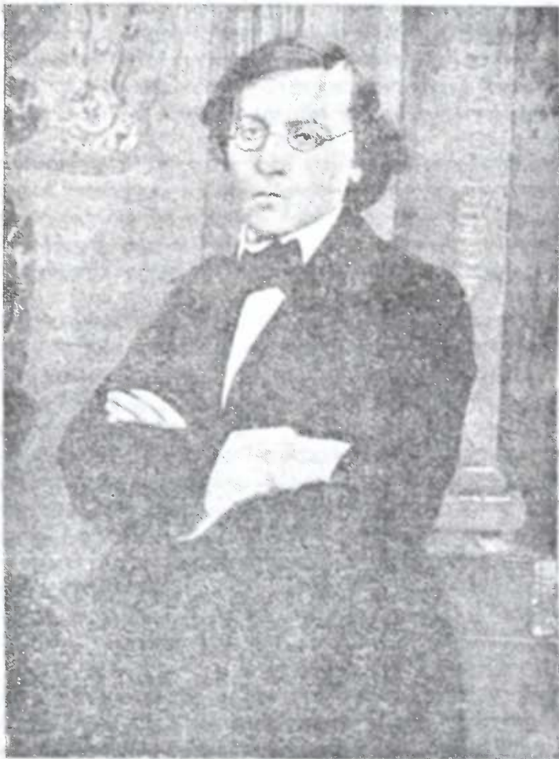
ნ. ხარნიშევსკი 1861 წელს.