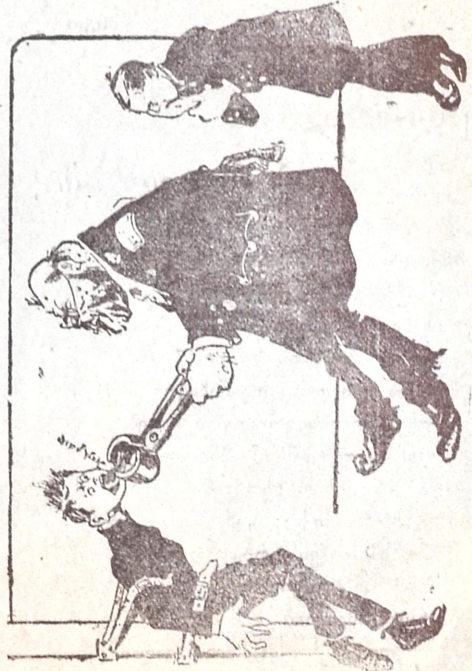
სიტყვის თავისუფლების ახალი კანონ-პროექტი.