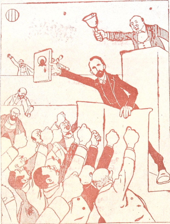
აუპალ-მაუპალი სათათბიროში ჩხვიძის წინააღმდეგ!

ოდეს გიგონებ ტურფავ მე შენა, გლოვათ მექცევა კისკისი ლხენა; გული მიშფოთავს, სული წრიალებს, და შიგ გუზგუზით ცეცხლი ტრიალებს! თვალთავან მომდის მწვევე ცრემლები, სიმწრისა ოფლში ვიხარუვი, ვდნები, ძირსა ვეცემი სასო მიხდილი და მიშხამდება სიცოცხლე ტკბილი... თრთოლვა კანკალი, სულის კვეთება — საბრალოს გულში მიორკეცდება!..