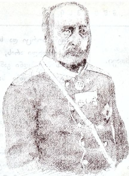
გიორგი გოგოლაშვილის პორტრეტი.

ვისანი, შენი შვილიც კუდას ყოფა-ქცევისა შეიქმნება უთუოდ. შეილო, ოქრო გქონდეს თუ ვერცხლი, ყმა ანუ მამული, იმის სწავლაზედ შესწირე, როდესაც რომ ისწავლის, ერთი ათათ, ერთი ოკად შეგმატებს, უკეთუ მსწავლული იქნება, უკეთუ უსწავლელია, რაც რაზა გაქვს, მავასაც დაკარგავს, და შენც შევა-