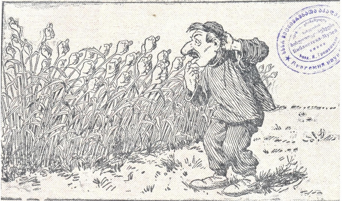
დასთესა თავის გუწეგით და მოსავალიც უხვი მიიღო.

სსსრ კავშირების საბჭოთა კავშირის ბიბლიოტეკა-მუზეუმი ი. მ. გ. გ. გ. გ. სსსრ კავშირების საბჭოთა კავშირის ბიბლიოტეკა-მუზეუმი ი. მ. გ. გ. გ. გ. სსსრ კავშირების საბჭოთა კავშირის ბიბლიოტეკა-მუზეუმი ი. მ. გ. გ. გ. გ.