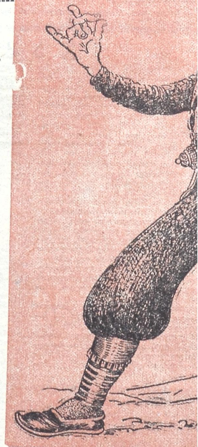
— ზაღარანიცაში უნდა წავიდი ჩემი

ს. სპირის აღმასკომი ამით აცხადებს: დენის კარგი მოსავლით გახარებულინი ხშირად საქმის დღეებშიც ნიშუას მივირთმევთ. საქმეზე მოსულ გლენებს ვთხოვთ გერ გაიგონ—მოვრალეები ვართ, თუ არა და თუ ფხიზელი აღმოვჩნდით, მხოლოდ იმ შემთხვევაში მოგვმართონ საქმიანობის, აღმასკომის თავმჯდომარე