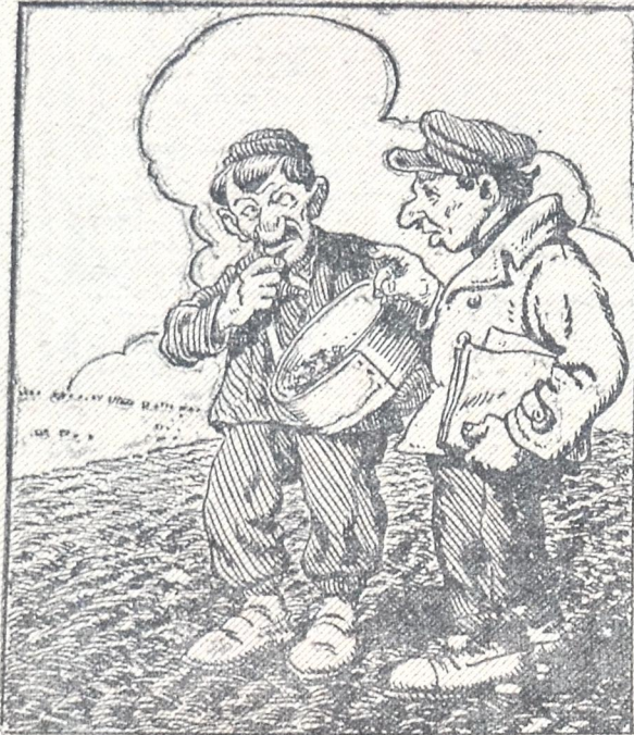
— სათესლმ უნდა დაარკვეიო და გას- წმინდო, თუ გინდა რომ მოსავალი გე- ქნეს...