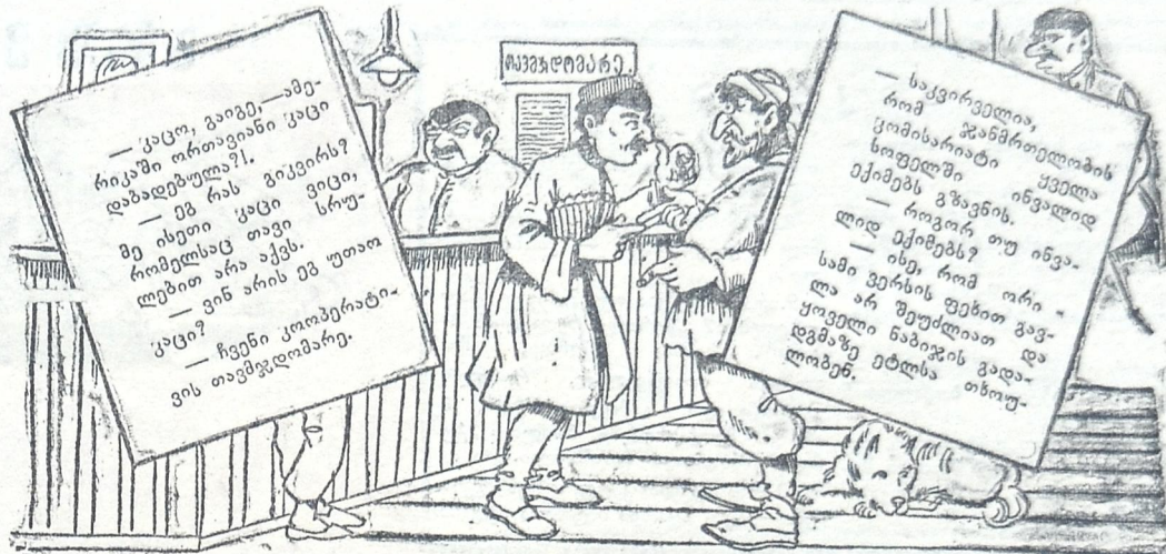
— მთელი დღე უშედეგოთ დავდივარ... ის მაინც გამეგო, რა მიზლის ხელს, სად მარხია ძაღლის თავი! — კი არ მარხია, აი ეგერ ზის!