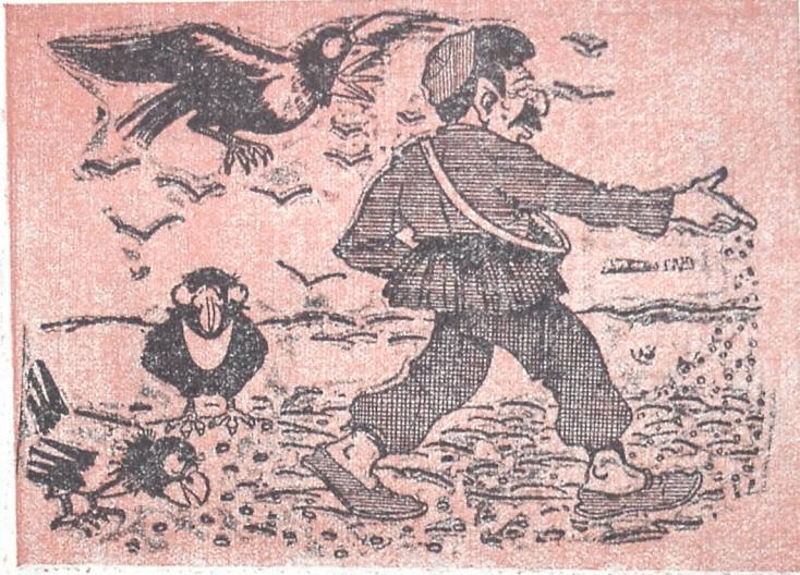
მშაპნი: ერთი ამ ტუტუს დახედეთ, გაუ სავალი მაინც არ ექნება და აღარც ჩვენ