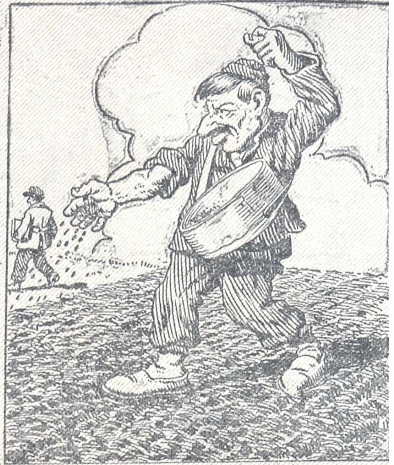
— ჩემს ვაგა-ვაგას თუ არ დაუტკევიდა და გაუწმინდა, იმიტომ კურიც ალარ უჭამია, აი!