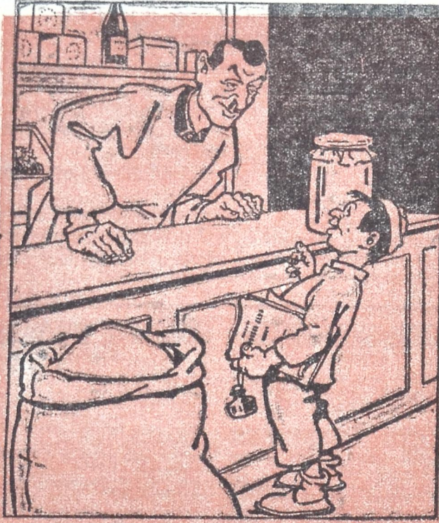
— რამე ვიყიდო ათი კოლოფი წყურჭულა, — არა, მადლობა... ანგარიშის გაკვეთილი ერთი მანეთის ბრინჯი და ორი აბაზის სამონი რა უნდა მომცე ხურდა ათ მანეთიდან? — რვა მანეთი და ნაკაპიკი, ავიწონო?