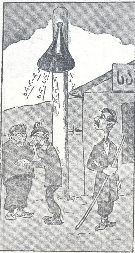
— რა უპატრონოთ იხრჩობა საწყალი!

ორ თებზე მეტია დაღუპა ს. ყვირილი რადიო. მის შეტყობაზე არავინ ზრუნავს. გლეჯილის წერილიდან.