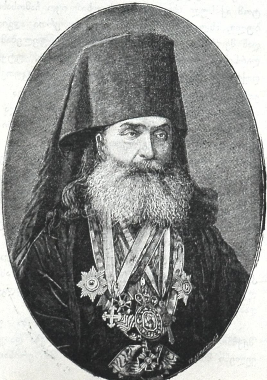
† ყოვლად უსამღვდელოესი იმერეთის ეპისკოპოსის განრიკი.

შინაარსი: † ყოვლად უსამღვდელოესი იმერეთს ეპისკოპოსი გ. ბრიელი. — ცხოვრება და მწერლობა გ. ბრიელისა. — ს. ვა-და-სკა ამბები. — საყურადღებო ამბები. — გვირიდ ნ კვირამდე, გრ-ოლ-იქესი. — ხალხური ლექსი. — * * * ლექსი ენ. ნინო ჯამ-ორბელიან-სა. — ის კი მიდიოდა, ან. დეკანოზი შეილისა. — საღვთო ნილოსი. — თავ. სვიმონ წერეთლის სიტყვა. — სოფელი და სასოფლო სკოლა (დასასრული), საზღვარ-გარეულისა. — ბიბლიოგრაფია პ-რე ს-ძისა. — და ქუთაისის პანკის განცხადებები. —