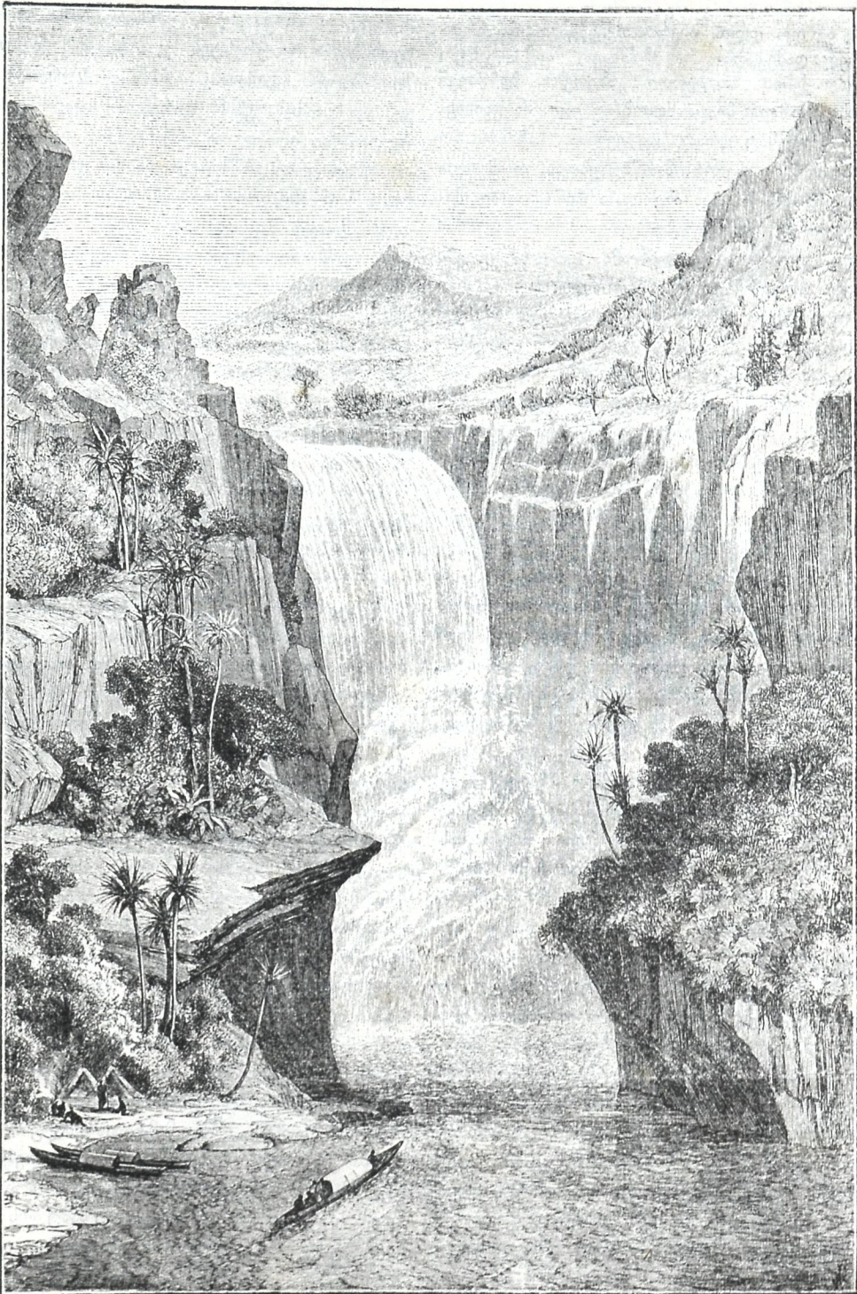
მ თ რ ჩ ი ს ო ნ ი ს ჩ ა ნ ჩ ქ ა რ ი.

ლი მარიამობისთვის დამლევაშდე ნალოსის სათავე- ში ყოველ დღე კოკის პარული წვიმა მოდის. ამ წვიმას ტროპიკული წვიმა ეწოდება და ნილოსის აღიღების მიზეზიც ეს წვიმებია.