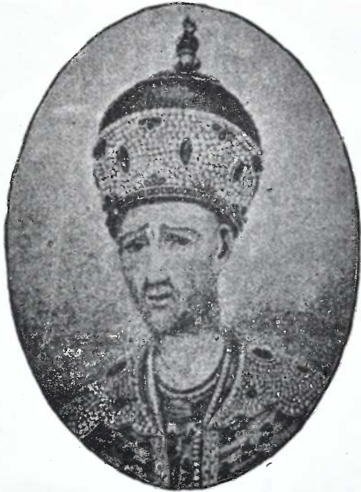
ყაჯარი ალა მამადხანი.

საჭურისი, დაუძინებელი მტერი ერეკლე მეფისა. 1795 წ. ქურდულად დაეცა თფილისს და ადაოხრა, 1797 წ. მეორედ მოდიოდა ასაკლებად, გზაში მოკლა მისმა მსახურ მცხეთელ ანდრიაშ, თათრობაში სადინა. ერეკლეს უთვლიდა: რუსებს ნუ ეკედლებოდა. ერეკლეს პასუხი: მას თქვენ დაგვანებოთ თავი და ქვეყანას ნუ გვიარბევთ.