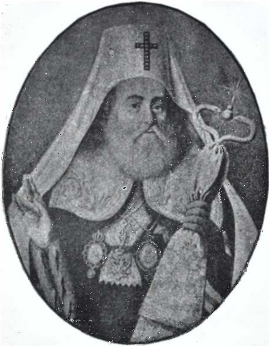
ანტონ კათოლიკოზი II.

ქე ირაკლი მეფისა, დაიბადა 1765 წელს, ამის გამგეობით გათავდა კათალიკოზობა საქართველოში, 1812 წელს გადასახლდა რუსეთს, იქ მიტროპოლიტობა და ჰატოვი მისცეს.