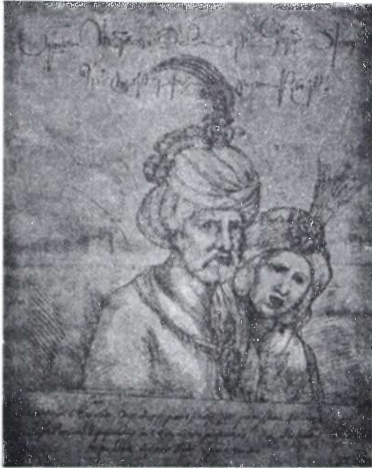
მეფე თეიმურაზ I მეუღლით.

ეს არის მეორე გმირი იმ უბედურებისა, რაც კახეთს ეწვია 60 ათასი კომლის გადასახლებით ჭკართლის ამოუღებელ-ამოწვევით შაჰბაზისაგან. დაიბადა 1595 წ. გარდაიცვალა 1663 წ. იყო მწიგნობარი, სწერდა ლექსებს.