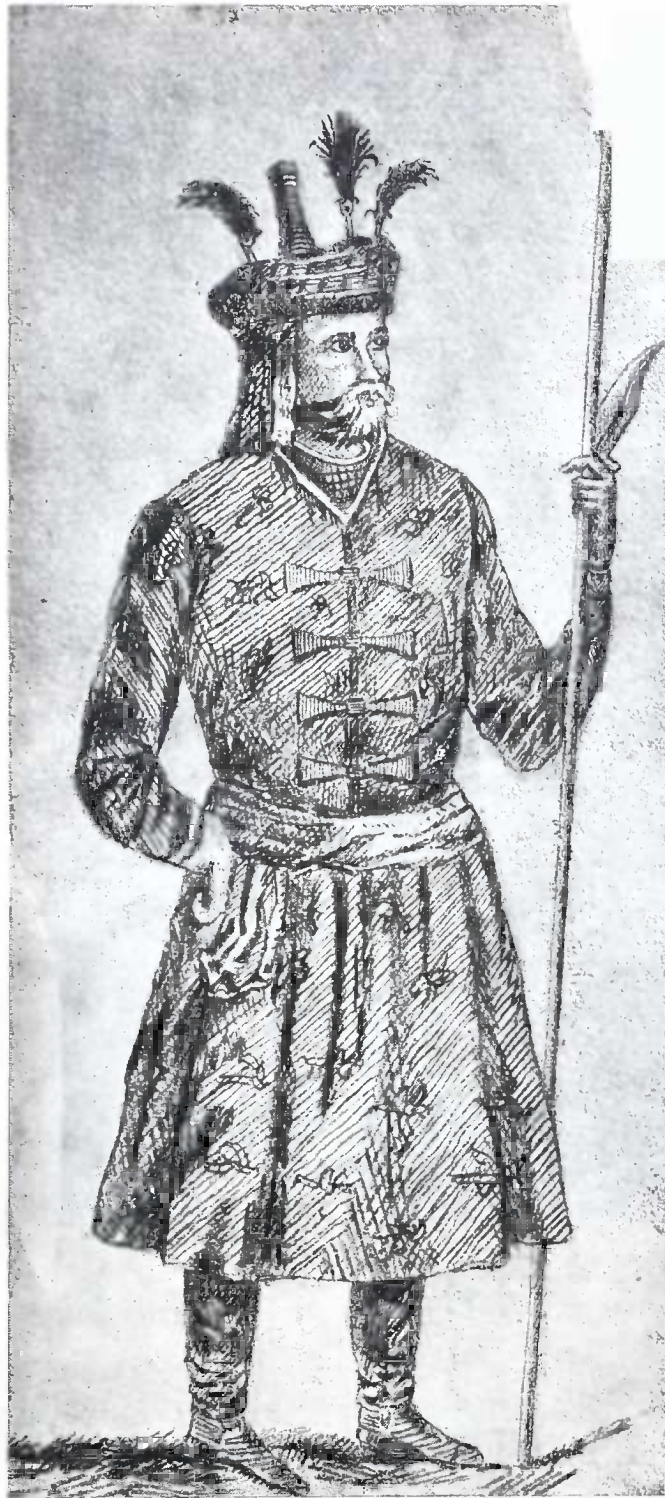
მეფე ალექსანდრე კახეთისა.

იყო გონიერი კაცი. ერთ დროს გათათრდა, ალექსანდრე რუსეთთან კავშირის გამო მოკლულ იქმნა შაჰაბაზის ბრძოლებით.