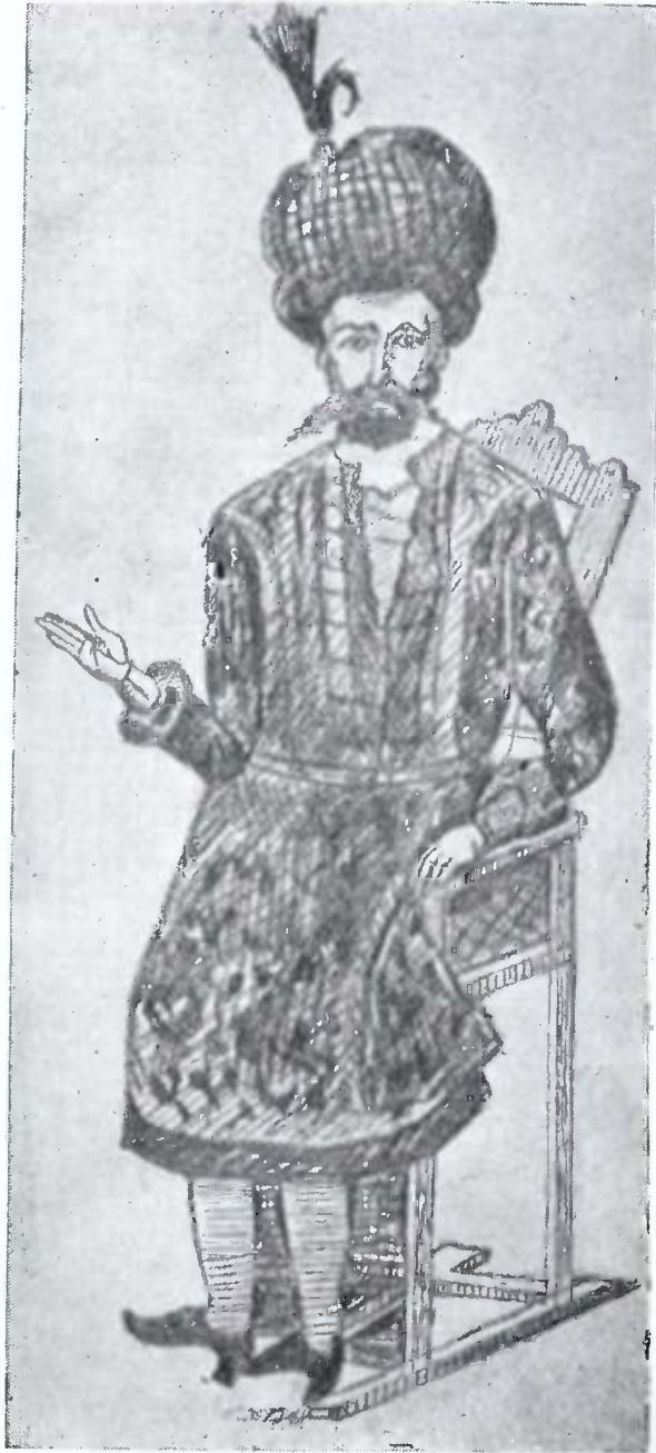
ირაკლი მეფე I.

თათრობაში ნაზარ აღიხანი. ჩუმი ქრისტიანი, დიდი მოჭირნახულე ქართლ-კახეთის გაძლიერე- ბისათვის. სპარსეთ-ოსმალეთს კარგად ეჭირა საქმე.