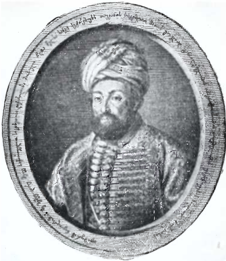
თეიმურაზ მეფე კახეთისა.

მამა ერეკლე მეფისა; გადასახლდა რუსეთში, კახეთის გამგეობა თავის შვილს ირაკლის გადასცა, ამით ისარგებლა ირაკლიმ და ქართლ-კახეთი შეაერთა. სიმონ მე- ფის შემდეგ, პირველად თეიმურა- ზი დაგვირგვინდა ცხეთაში ქრისტიანულის წესითა. თეი- მურაზი რუსეთში გარ- დაიცვალა 1764 წელს.