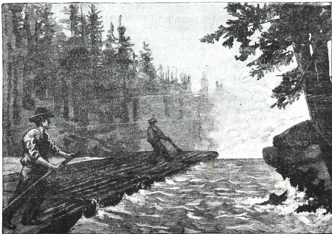
ა. მ. ე. რ. ი. კ. ა. შ. ი. ს. ზ. ი. დ. ვ. ა.

ის შეიღის წლისა ერთი თავისი ნათესავის შემწეობით შეღის სასწავლებელში და შეწეირათ სწავლობს. 15 წლისას მას „უკვე“ ვადაკითხული ჰქონდა ჩვენისა და უცხოეთის მწერლების საუკეთესო ნაწერები“. ფრანგულიც არა ნაკლებ იცოდა ქართულ და რუსულზე. ევა მუდამ იმაზე ოცნებობდა, თუ როგორ გამოდგომოდა თავის ქვეყანას. ვინაიდან სამკალი მრავალი იყო, და მუშაკნი მცირე, იგი ხედავდა თავის დიდ მოვალეობას ქვეყნის წინაშე. მაგრამ „ევას კაცობრიულს აზრებს მოკლე ფრთები აღმოაჩნდა“. მისი ნათესავი, რომლის ხარჯითაც იზრდებოდა იგი სასწავლებელში, ვადაცივალა, რის გამო იძულებული შეიქნა სასწავლებლიდან გამოსულიყო.