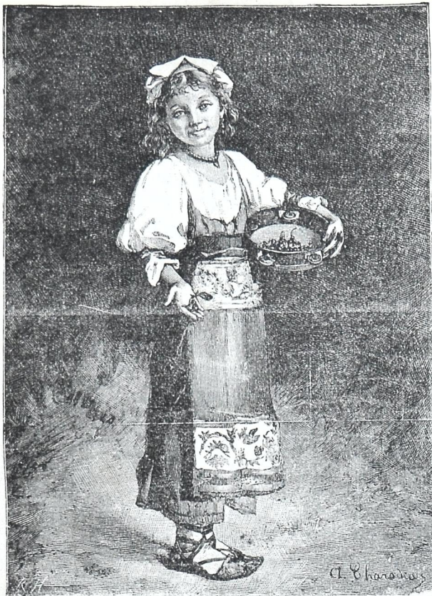
იტალიელი ახალგაზდა ქალი.

დროშაზე წერია: tout pour le peuple, tout par le peuple—ყველაფერი ხალხისათვის, ყველაფერი ხალხითვე. ვინც ამ დროშას ქვეშ იბრძვის, ის იბრძვის ხალხისათვის, ვინც ამ დროშას ებრძვის, ის იბრძვის თავისთვის ხალხის წინააღმდეგ. დეე, მუშახალხმა შეიგნოს რაც არის და რაც უნდა იყოს. დეე, გამედიდურდეს, გაამპარტავენდეს, რომ მხოლოდ მას ასეთი უდიდესი მოვალეობა ისტორიამ არგუნა!..