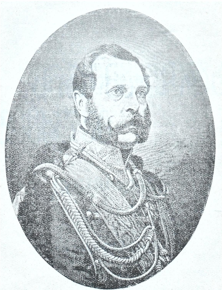
სელმუიუე ალექსანდრე II.