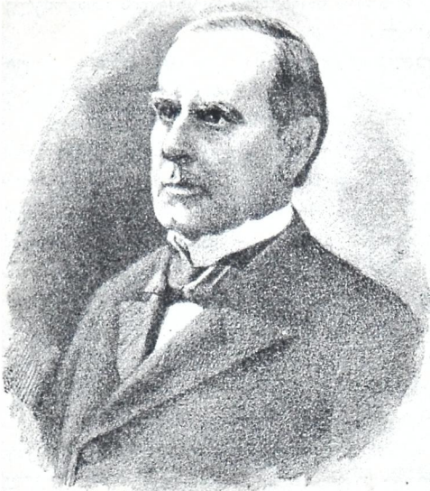
ამერიკის ახალი პრეზიდენტი ვილიამ მაკ-კინლეი.

ყოფილა, მიუხედავთ ამისა შეძლებული საზოგადოება თაის მოვალეობათ რაცხდა ასეთი სასწავლებლის გახსნას, რისთვისაც ხაზინა ფულათ დახმარებას უჩენდა. ასეთი დახმარებით და წახალისებით სკოლამ ხალხში ფეხი მოიდგა, ასე რომ კანონით რომელიც სავალდებულო არ იყო, ცხოვრებაში სავალდებულოთ გადაიქცა. ამ ასპარეზზე განსაკუთრებითი შრომა მიუძღვის „ხალხში განათლების გამაგრებელ საზოგადოებას“, რომელიც გერმანიის ყველა კუთხეში არსებობს და იღწვის. რაკი ამ სკოლამ ისე მოიკიდა ფეხი და მისი საქირაობა აშკარა შეიქმნა, მთავრობამაც შესაფერი ღონისძიება მიიღო და შარშან (1895 წ.) 22 მარტს კანონით დაადგინა, რომ ეიტრტემბერგის ყველა საზოგადოებამ უნდა უსათუოთ გახსნას სწავლის გასაგრძელებელი სკოლაო. აი, რამდენიმე მუხლი ამ კანონისა: