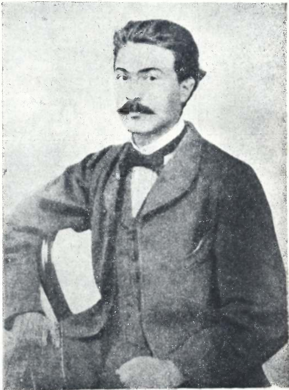
ანტონ ფურცელაძე (1839—1913)