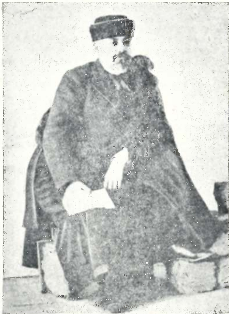
დავით კახელი (1861—1907) გადასახლებული ციმბირში 1905 წ.

აი მაგალ. როგორ გავატარე ეს დღე. რვის ნახევარზე ავდექი. სანამ პირს დავიბანდი და ტანთ ჩაიცვამდი 10 შესრულდა. დილის ლოცვას და ჩაის მოუნდა ერთი საათი. ჩაის შემდეგ ნახევარ საათი ლაპარაკს მოუნდა, საათ-ნახევარიც ვიმეცადინე. ეგეც 11 საათი. დარეკეს შუა დღის ლოცვა, რომელმაც მოითხოვა 2 ნახევარი. (რადგანაც წყლის კურთხევა იყო). წირვის შემდეგ სა-