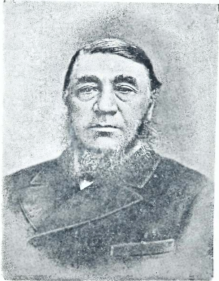
პავლე კრიუგერი ტრანსვაალის პრეზიდენტი