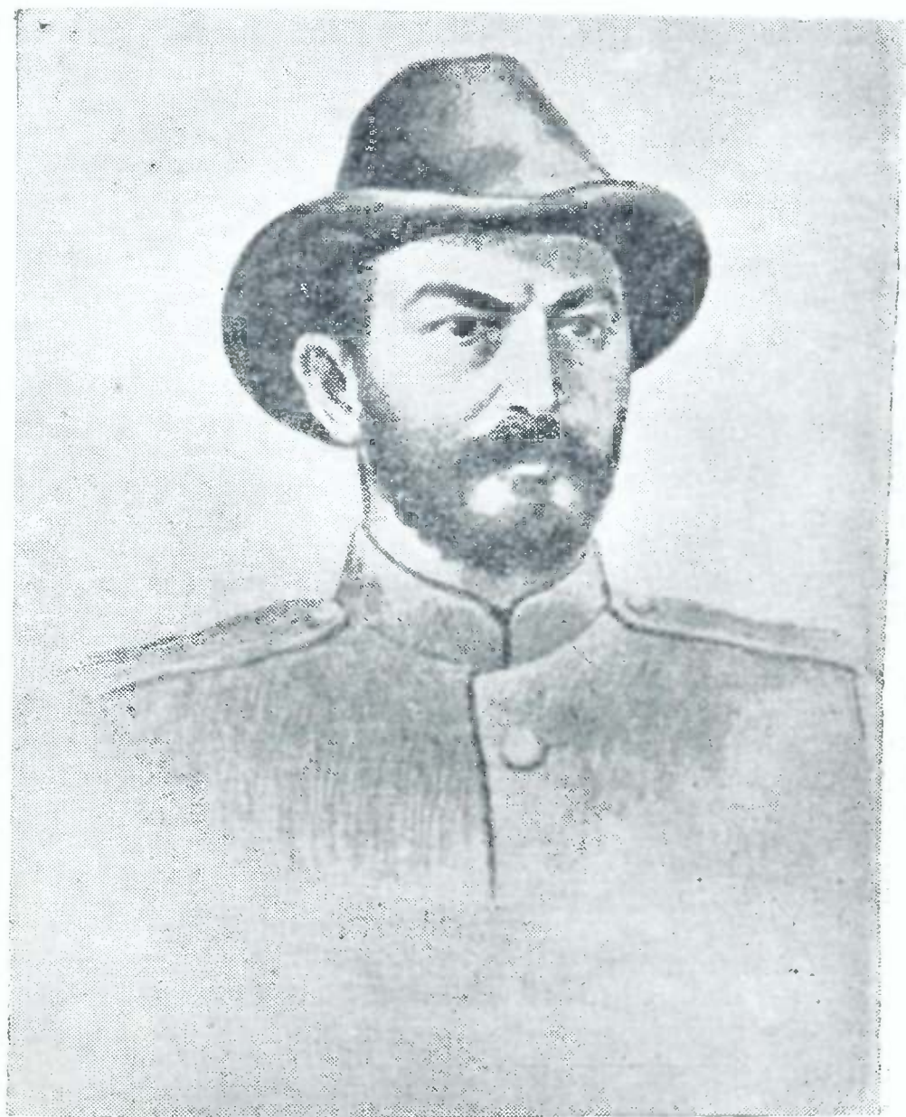
გენერალი ბოტა ბურჯინის უკანასკნელი მთავარსარდალი