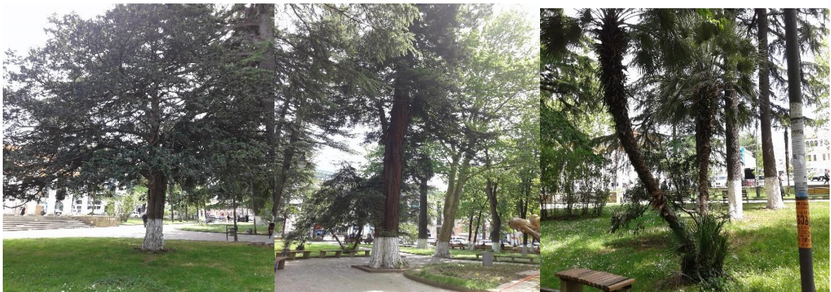
3. ევროპული ურთხმელი. 4. მარადმწვანე სექვოია. 5. იაპონური ცეფალოტაქსუსი

სარწმუნო წყაროებიდან ქალაქ ქუთაისის ცენტრალური ბაღის მოვლა-პატრონობისათვის სამსახური დაახლოებით 1950-იან წლებში ჩამოყალიბდა. წლების მანძილზე მიმდინარეობდა ბაღის განახლება და მოვლა-პატრონობა. 2008 წლიდან კი სამუშაოები მიმდინარეობს მხოლოდ სეზონურად ყვავილნარების განახლებით, ზოგჯერ მერქნიანების შემატე-ბით და მოვლით. ცენტრალურ ბაღში არსებობს უნიკალური მერქნიანი მცენარეები როგორცაა ევროპული ურთხმელი, რომელიც მდებარეობს ბაღის აღმოსავლეთ ნაწილში კოლონადის შესასვლელთან. სამხრეთ-აღმოსავლეთ ნაწილში არის მარადმწვანე სექვოია, ყველაზე მაღალი ხე მსოფლიოში, აქვე სექვოიას მოპირდაპირე მხარეს, ფორჩუნის ტრაზი-კარპუსის ძირში ერთადერთი ეგზემპლარი ლამაზნაყოფა წიწვოვანი ბუჩქი - იაპონური ცეფალოტაქსუსი (სურ: 3, 4, 5).