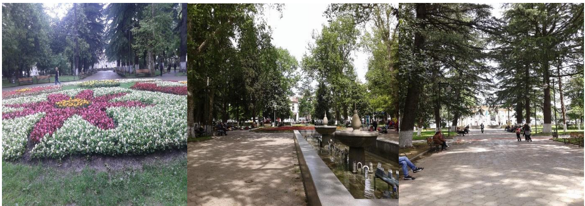
სურ. 6, 7, 8.