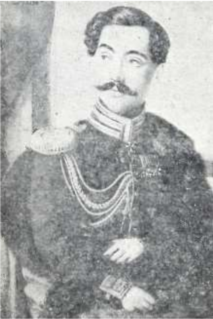
სამეგრელოს უკანასკნელი მთავარი დავით დადიანი