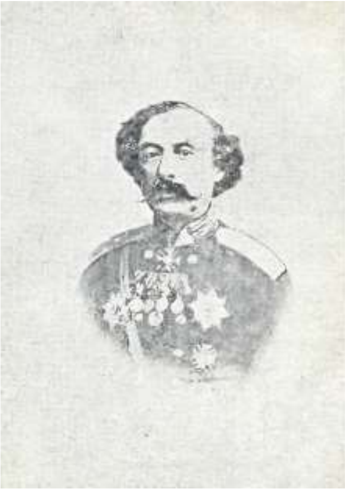
სამეგრელოს მთავრის ძმა გრიგოლ დადიანი (1814-1902) — მწერლობაში კოლხიდელის ფსევდონიმით ცნობილი.

თუმცა დავითი მაშინ მთავარი არ იყო, მაგრამ ხელმწიფის დიდი ზემოთ მიღება მისი საქმე იყო და მისი ხარჯით იყო მორთული.