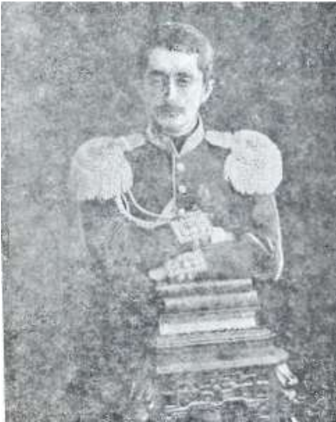
ნიკოლოზ დავითის-ძე დადიანი (1847-1902), სამეგრელოს სამთავროს ტახტის მემკვიდრე, რომელმაც ხელი სრულიად აიღო ამ ტახტზე. 1886 წელს რუსეთის მეფის კანდიდატი იყო ბოლგარეთის მთავრის თანამდებობაზე.