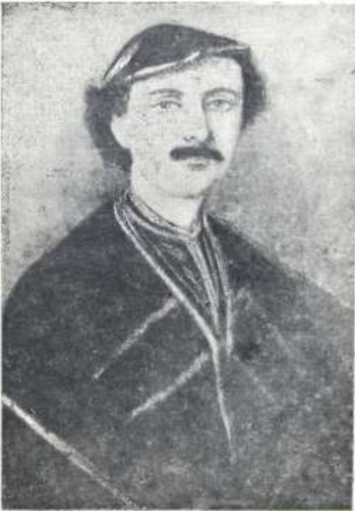
სამეგრელოს მთავარი ლევან V დადიანი (1791-1846)