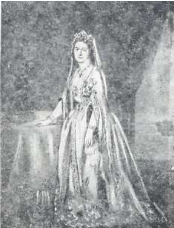
სამეგრელოს დედოფალი ეკატერინე — ალექსანდრე ჭავჭავაძის ასული (1816-1882)

წყვდიადი, რომელიც გადაჰვენოდა ამ ჩვენს მხარეს, განუკურმა იარანი, რომელნიც მიეღო იმ დაუდგრომელ