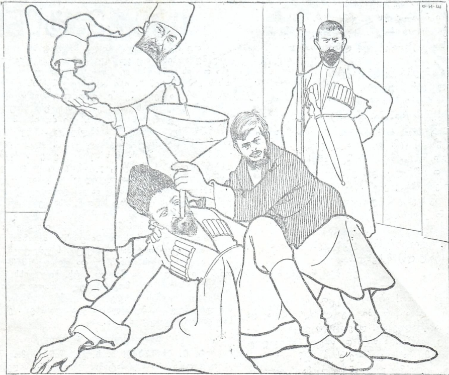
ლეჩხუმელ თავადის ქეიფი ახალ წელიწადს.