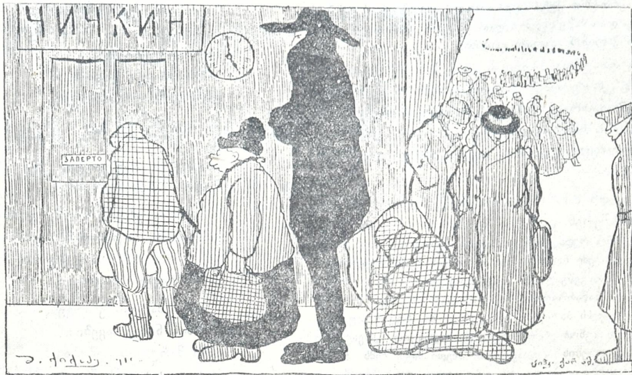
მოსკოვის ქუჩების ქვილილის 5-6 საათზედ მალაზიებთან.