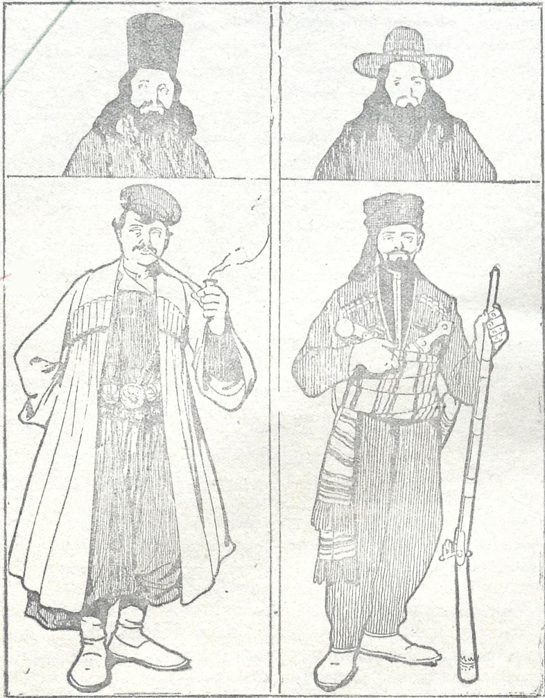
ქალაქის მღვდელი. უწინ (ზემოთ) და ახლა (ქვემოთ).