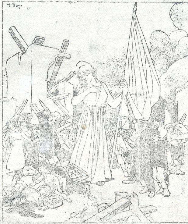
რევოლუცია აბა რას ვიფიქრებდი, თუ რუსეთი ასე მოუმზადებელი იყო ჩემს შესახვედრათ!