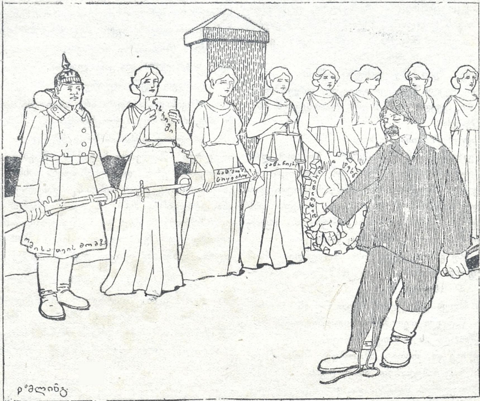
საღდათი. განა გასაკვირია, რომ ასეთი ფრონტის წინა- შე უკან დახვევა გვიწევს?