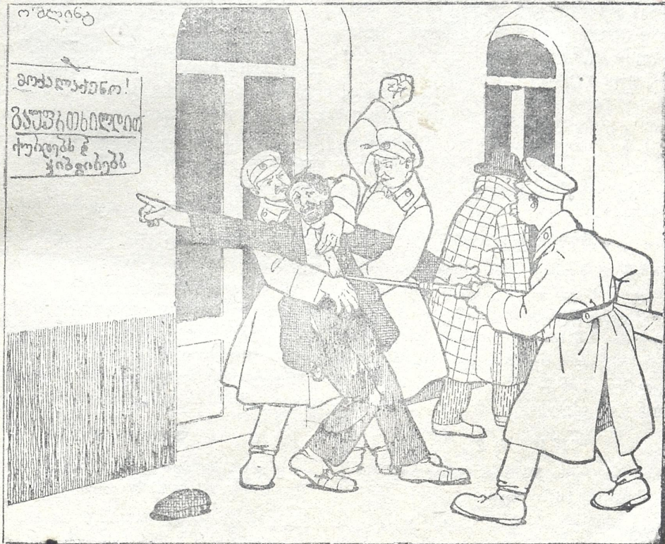
ქურდი. ამხანაგებო! თქვენ გინდათ თავი ქვით გამიკეპუოთ. ვანა ეს არის ახალი მთავრობის მომხრეობა? აი წაიკითხეთ; იქა სწვრია გაუფრთხილდით, გ. ი. არაფერი ავნოთ ქურდებსო.