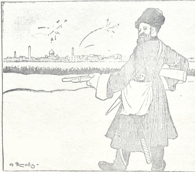
კერენსკის ეძებენ! არ იქნა, ვერ ნახეს,