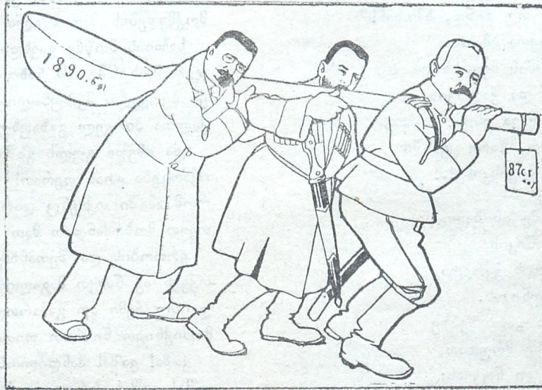
მიჰქონდათ ციხევი და იძახოდენ: „ხაბარდა!!!“