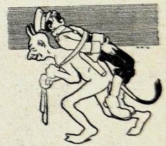
ჩვენი დროის რაინდები.

„ჩუნიანი, მეუბნება გადამეკიდა პლატო... დონს შე... ჩემს ბიოგრაფიაში ბევრი რა...“ სანაშავეი გამოგრჩენიო, მაგრამ ერთ გამოტოვება მინც არ შეიძლებაო, როდესაც საზღვარ-გარეთიდან ჩამოვედიო, ყველას რომ თავი დავანებოთ, ნიორის გაკეთება ხომ მინც სპეციალურათ შევისწავლე, მოვიწოდებ აქაურ გლეხკაცების გაბედნიერება ნიორის კეთების საშუალებით, მაგრამ რა შექნა, ბოიკოტი დამადგეს და როგორ მოეუწყო ხელი მათო. იმედია ამას არ გამოტოვებთ ჩემს ბიოგრაფიაში!“. რა ეტყუათ, იმ კაცმა თუ სწავლა-განათლება ვერ მიიღო საპატივით ნიორის გაკეთება სკოლითა, არ ვიცი თ ამისთვის დაადგეს მას ბოიკოტი? ნიბლია.