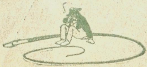
„გასწი შერანი! შენს ჭენებას არ აქვს სამსლეარი!“