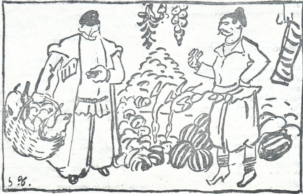
ფული ბაზარში პატარა პორტმონეთი მიჰქონდათ, ხოლო ნაყიდ სანოვაგეს დიდ კალათაშიაც ძლივ ატევდენ.