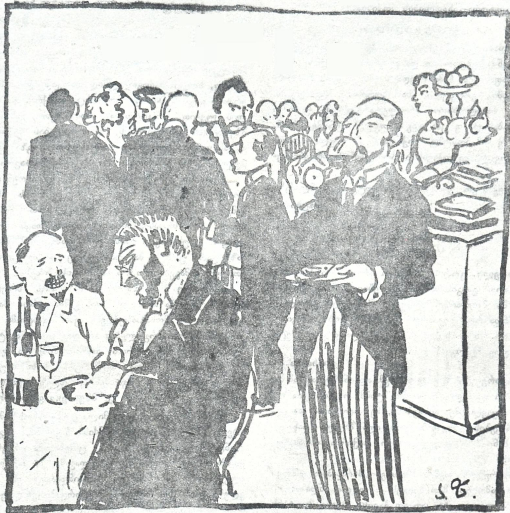
აქ კი, საუზმის მისართმევე ოთახში, ქვორუმი ყოფილა. ასე განაცხადა 'კრების ერთმა წარჩინებულმა წევრთავანმა. ცხადია, ქვორუმი პრეზიდენტზე და მთავრობაზე უფრო დიდი კაცი ყოფილა.

ფასთა ხელოვნურ—ზრდა-აწევაში დამერწმუნები ტოლი არა ყავთ, ყოველ გვარ ბოროტ-მოქმედებანი, როგორც მათ უჯობთ, იმ რიგათ გაპყავთ... მოქალაქე კი ხედავს ამაებს,— მაგრამ შიმშილით რაღა ეთქმება, ფასთა დღიურ ზრდას, შეურაცყოფის, ძალაუფლებურ ის ურიგდება. ვიცი, რომ მეტყვი: „რას აკეთებსო ადგილობრივი ამ დროს მთავრობა, (კითხვისთვის მადლობთ. ღმერთმა გიკითხოს და ნუ მოგაკლოს მისი წყალობა!) ჭე არის ისე ქეიფის გვართ. ან კი რაღა ქმნას ამაზე მეტი, ნეიტრალიტეტს იცავს ჩარჩებთან, ვერ ვნახეთ მათგან ჩვენ განამეტი. იონჯი.