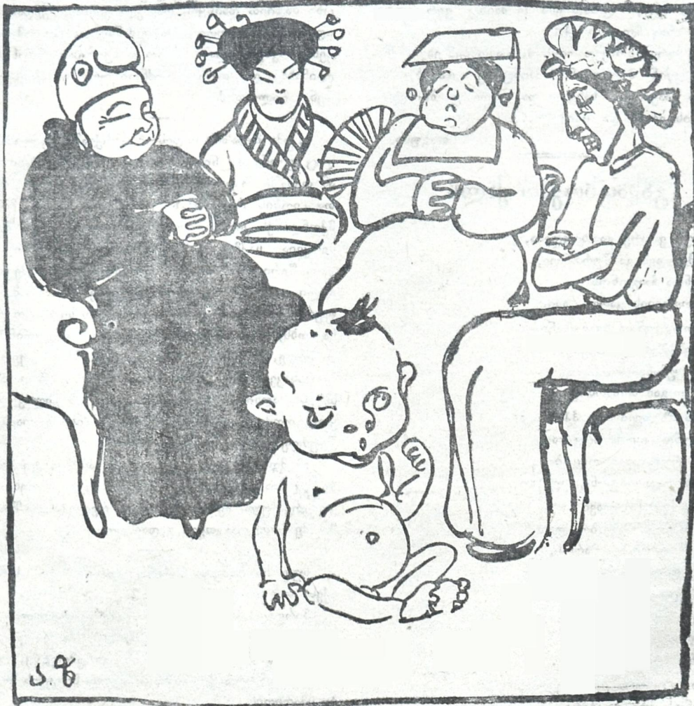
ანტანტის სახელმწიფოები. (ნაზის სიყვარულით დასტკერიან ახლშობილ ზავს) რა კარგი ბიჭუკეაა, ამას კი ენაცვალოს მისი მშობლები!..

უმთავრესი ღირსება თამაღისა, ზოგადი სიტყვით თუ აღვნიშნავთ, გახლავთ მამა; მამა ქამისა, მამა სმისა, მამა მზიარულებისა. აქედან ცხადია, რომ, რაც უფრო დიდი იქნებოდა ამა თუ იმ პიროვნების მამა, განსაკუთრებით კი მამა სმისა, შით უფრო სახელოვანი იქნებოდა თამაღა. პირველ ყოფილი ქართველი, ახლად ჩამოსული არაბატის მთიდან და მის კალთებზე დასახლებული, ცდილობდა მოეწაზა რაიმე საგანი ამ დიდი მამის აღსანიშნავად. არაფისთვის საკვირველი არ უნდა იყოს, თუ მისი ყურადღება მთამ მიიქცია, ვინაიდან ყველაფერზე დიდი ჰვენს გარშემო მხოლოდ „მთა“ არის.