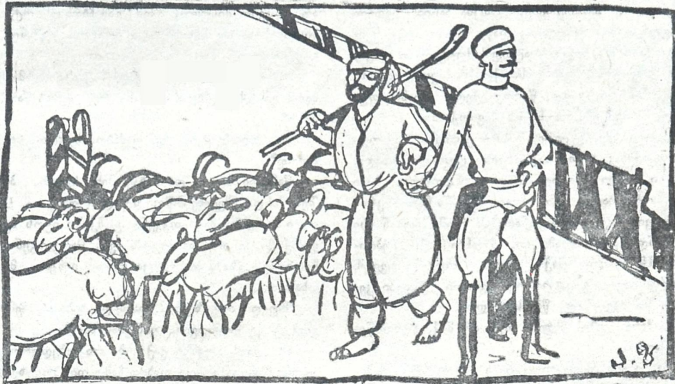
დარაჯი. დღიდან ლამიანა აქა ვღვევარ, საზღვარზე, ძილი არა მაქვს და მოსვენება, ასი თვალი მამბია და აბა რა ჯანდაბა უნდა გამეპაროს ბათომისკენ.