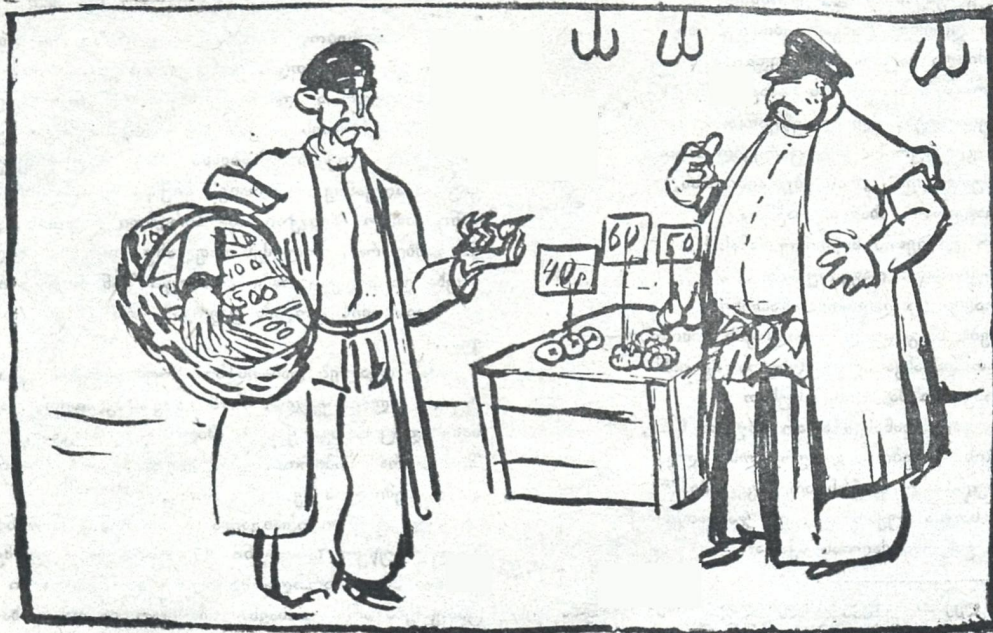
ფული ბაზარში დიდი კალათით მიიქვით, ხოლო ამ ფულით ნაყიდ სანოვაგეს პატარა პორტმონეთშიაც თავისუფლად ათავსებენ.