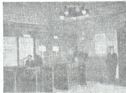
ათასი, სჯა აწარმოებენ ეგულა (თაერადიებს) საქმეებს სოპინის ამხანაგობაში.

წევრების მიერ შესანახად შემოტანილი ფული 1912 წელს უდრიდა 149,258 მ. საკუთარი თანხები 3,400 მ., \frac{1}{10} და მოგება 1912 წელს აღიოდა 12,941 მანეთამდის! და ამხანაგობის ბალანსი 281,602. სახელმწიფო ბანკსა და მთავრობამაც კი დახმარება გაუწია სოპინის ბანკს და მისცა სესხად სხვა და სხვა დროს 38,600 მანეთი. მაგრამ ეს დახმარება აღმოუჩინეს ამხანაგობას მაშინ, როცა დაინახეს სამაგალითო მოღვაწეობა ამხანაგების მესვეურებისა. ამ რიგად, მოყვანილ ცნობებიდან ჭ