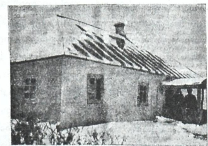
სახლი, რომელშიაც დაიწყო მოქმედება სოპინის ამხანაგობამ 1907 წ.

1 მარიაპოლისთვის 1907 წელს სოფ. სოპინოში, კიევის გუბერნიაში გლახებმა გახსნეს საკრედიტო ამხანაგობა. სახელმწიფო ბანკმა მისცა დასაწყისში გრძელ ვადიან სესხად 2,000 მანეთი. ამ პატარა თანხით დაიწყო თავისი მოღვაწეობა სოპინის საკრედიტო ამხანაგობამ. ამორჩეულ გამგეობის წევრებმა და საბჭომ გადასწყვიტეს უსასყიდლოდ ემუშავნათ. პირველ დღიდანვე ამხანაგობამ სამაგა-