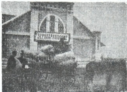
ხორბლის შესანახი საწყობი.

მოაწყო შუამავლობა წევრების პროდუქციის გასასაღებლად. ასაღებს წევრების პურს, რისთვისაც ააშენა ხორბლის შესანახი საწყობი, ჰყიდის წევრების მიერ მოტანილ საშაქრე ქარხანს და სხვა.