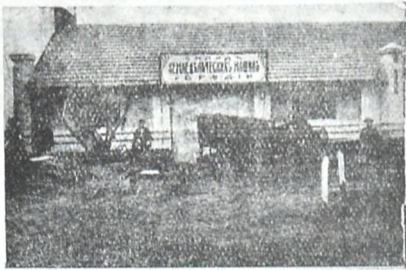
სოპინის სასოფლო-სამეურნეო მანქანების, პატისის და თესლეულობის საწყობი.

ამხანაგობამ მოაწყო სასოფლო სამეურნეო მანქანების საწყობი , სადაც ჰყიდდნენ — სამეურნეო მანქანებს, პურის საუკეთესო თესლეულობას, პატისსა, რკინეულობასა, ცემენტსა, კირსა, კრამიტსა, აგურსა, და სხვა და სხვა სოფლის საამშენებლო მასალებსა.