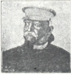
გრაფი ცეპელინი, ხელმძღვანელი გერმანიის საჰაერო ფლოტისა.