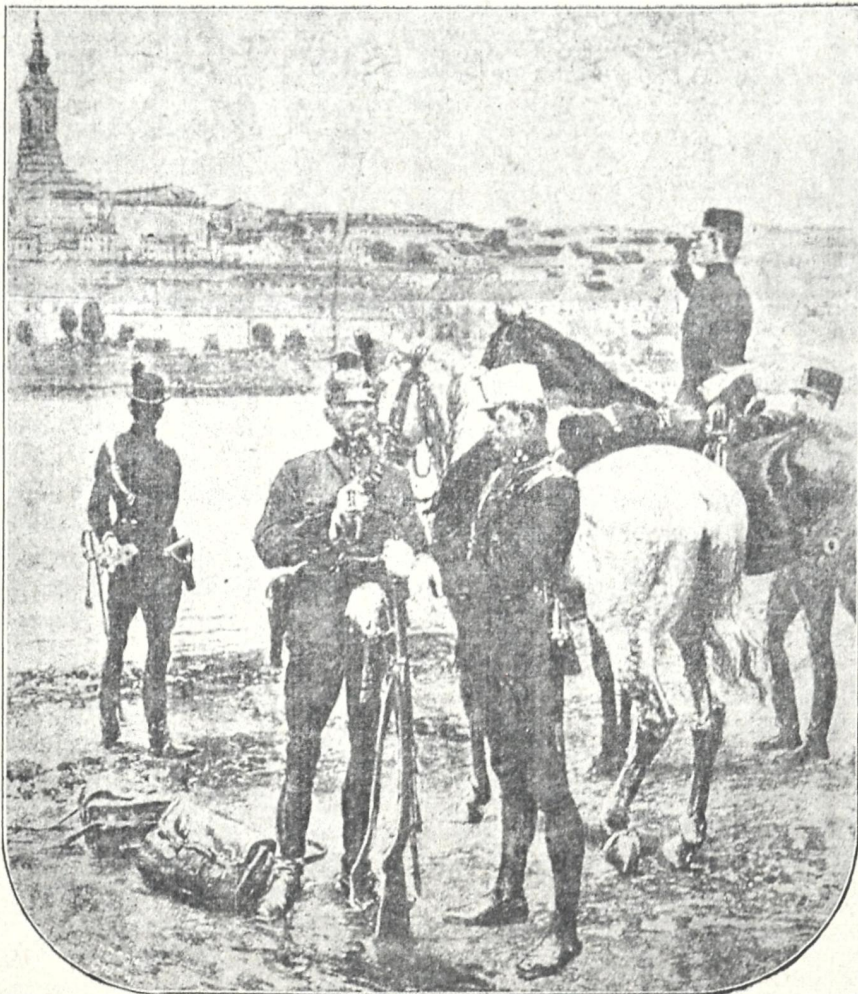
ავსტრიელი აფიცრები გასცქერიან ბელგრადს.

სომხურმა პრესამ შედარებით ნაკლები ყურადღება მიაქცია მეორე სადავო კითხვას: ალექსანდრეტას! უეჭველია, ხმელთა შუა ზღვაში გასვლა მათ მეორე ხარისხოვან საკითხად მოსჩვენებიათ. სომხური პრესა ვერც კი ნიშნავს, რომ, კითხვის ამგვარი დაყენებით პრობლემატიური საკითხი რუსეთის ხმელთა შუა ზღვაში გასასვლელად ასე ადვილად არ გადასწყდება. რა თქმა უნდა, აქ სომეხები ხაზს უსვამენ იმ გარემოებას, თუ რა სასარგებლო იქმნება მათთვის ხმელთა შუა ზღვის დაპყრობა სომხურ