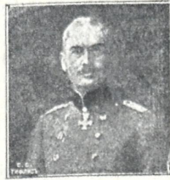
ოსმალეთის მთავარ-სარდალი ლენერალი სანდერი.

არ იყოს გაშუქებული და არ მიმტყიცებდნენ არა თუ მარტო „შიშის გამო“, არამედ „სინიდისის მიხედვითაც კი, რომ ოსმალთა დაცვა მათთვის საჭირო და საგულისხმეოა, როგორც მათ ეროვნულ ინტერესებთან ფრიად სასარგებლო რამ. ამის დასაბუთებლად უკვე მომყავდა მ. ს. აჯემოვისა და ა. ჯივლეგოვის აზრები, თუ სომხეთისთვის რა „სასარგებლო“ იყო ოსმალთა სუვერენიტეტობის დაცვა. შემდეგ პოლემიკაში სომეხთა პრესა შეეცადა ეს „სარგებლობა“ რაოდენადმე მაინც შეემსუბუქებინათ. მაგრამ ამ თეზისის გაშუქება სრულეობით ახალის სახით დავინახე სომეხ ლიტერატორ ბ. ლეოს წერილებში „დენის“ ფურცლებზე. ამნაირად, უნდა დავასკვნა, რომ ოსმალთა სუვერენიტეტის იღვის დაცვა შემთხვევითი და დროებითი კი არ არის სომხურს პრესაში, არამედ მუდმივი და შინაგანი სახიერება მათი ეროვნული ფორმულისა.