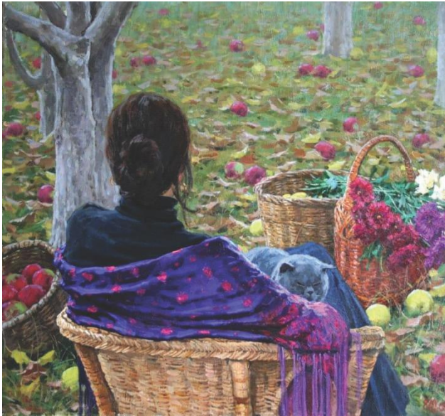
მხატვარი ევგენი მუკოვინი

ჩამოშლილ თმებში გზადაკარგული საყურესავით ეკიდა სევდა... და ბინდი სულში მოკუნტულ ტკივილს ვით ძველ ხელთათმანს, ისე არღვევდა, მე შენი სუნთქვა აღარ მწვავს კეფას გრილ ხელისგულებს დამეს ვაგებებ, და ვაშლის სურნელს ვიგუბებ სულში მიწით გამძღარს და მზეში ნაფერებს.