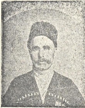
მალძინსაძე აბაშვიდი დასავლეთ საქართველოს სომეხთა გალობის დიდი მოღვაწე და სახელგანთქმული ლოტბარი.