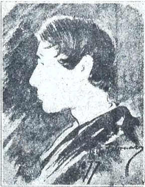
რაბინდრანთ თაგორე ინდოელთა სახელგანთქმული მოგვი-მწერალი.