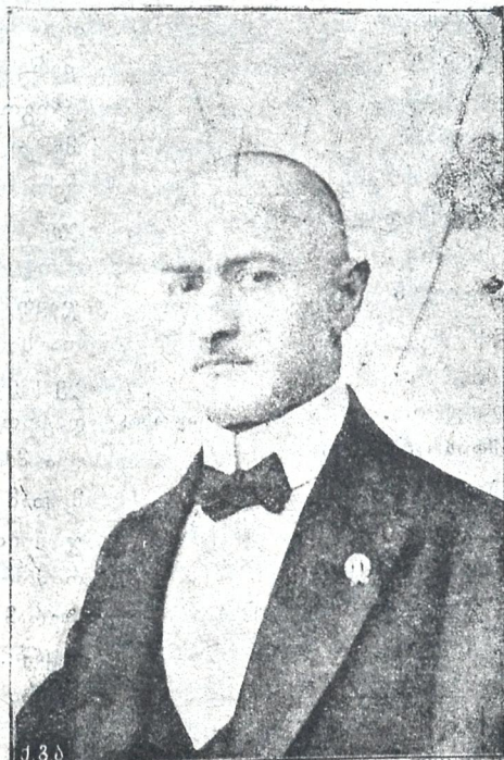
სერ. დავ. ჯუღარიძე საქართველოს რესპუბლიკის საქმეთა მმართველი.