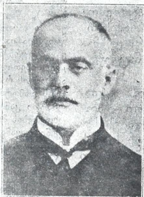
პეტრე სუგრულაძე ცნობილი მწერალი და პოლიტიკური მოღვაწე