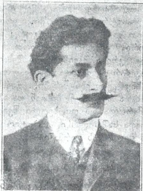
მიხეილ წერეთელი ცნობილი მწერალი და პოლიტიკური მოღვაწე.