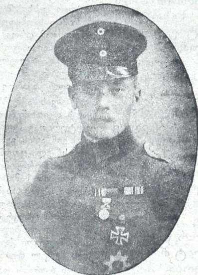
გრაფი შულენბურგი გერმანიის ელჩი საქართველოს რესპუბლიკის წინაშე თბილისში