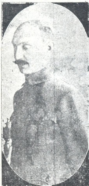
ვ. ვ. გომბელია (1878—1918)

მხოლოდ ერთს კი ვინატრებდი, ვყოფილიყავ შენთან ერთად, სიყვარული გარდაგვექმნა მარად სათნო, უცვლელ ღმერთად. გულის სიღრმე დამერჩილია შენს თვალთაგან შექმნილ ღამით ბროლის მკერდზე მოგხვევოდი, დამტკბარიყავ ნეტარ წამით კოცნის ცეცხლით აღგზნებულებს გულს გვირველს სუნთქვა ხშირი, გრძნობით მთვრალი ჩაგძახოდე: შენი ვარ და შენთვის ვტირი სიყვარულის სამსხვერპლოზე თავი გვედოს გასაწირად და ერთ სანთელს ვამზადებდე მისთვის მსხვერპლათ შესაწირად ღ. ძიძიგური