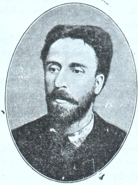
ეგნატე ნინოშვილი (1861—1894)

8 მისს შესრულდა ოცი წელიწადი, რაც ს. ჩოჩხათში (გურიაში) მიწას მიაბარეს ხაღისი გულის მესაღმუმი, ეგ. ნინოშვილი, 1894 წ. 29 აპრ. უღროოდ თვალდახუჭული.