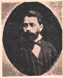
ო. ბაქრაძე (1852—1904) გარდაცვალებიდან 10 წ. შეს- რულების გამო