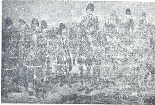
ქართველთა მილიცია რუსების შემოსვლის დროს.