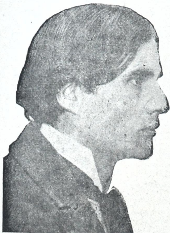
პოეტი გალაქტიონ ტაბიძე მის ლექსების მეორე ტომის გამოცემის გამო.