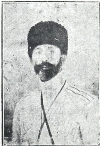
პოეტის ფიგურა ტიტი ართმელ ძე

მკრავი და სამსჯღრო მო- დეაწე, ვარის კაცია უნი- ვერსიტეტის დამარსებელი ქუთაისს, ფოთს და ოსურ ბუში. (დაწერილ შემდეგ)