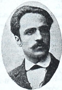
დრამატურგო ტრ. რამიშვილი