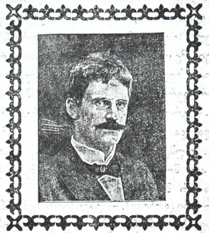
კნუტ ჰამსუნი დაბადებიდან 50 წ. შესრულების გამო (იხ. „თ. და ც.“ № 15, 16, 17)

საქმისას და ამითი თუ სრფელი მთლად არ აშენდება, დაქტევით მაინც ისე ადვილად არ დაიქტევა, როგორც ეს ზოგჯერ მომხდარა. შალვა დადიანი