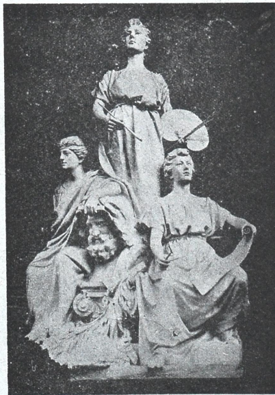
მხატვრობა, ქანდაკება და ხელოვნობა