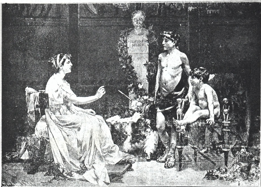
კორნელიაშესანიანივი დედა რომის მოქალაქეთა ტიბერიუს და კაიუს გრაქებისა.

შვილებს უქადაგებს კვეენის და ეროს სამსახურსა.