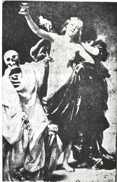
ახალგაზრდობა და სიკვდილი ლიუპის ნახატი