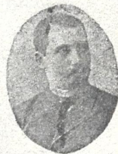
პ. ი. ყიფიანი

ცნობილი საზოგადო მოღვა წნ, სხვადასხვა საკულტურო- საგანმანათლებლო დაწესე- ბულებების დამფუძნებელ-მო- ზიარე, სოციალ-ფედერალი სტოპარტიისწევრი, გარდ აიცვალა კიათურაში