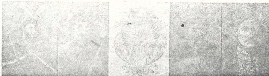
პეტ. დოროზენკო ივ. ვოვნესკი უკრაინის გერბი ბ. ხმელნიცი ი. მაზეპა

და ზერემიშლის საზღვრებში და ჩადიდრად მოსავლეთით ზუტაფლი.