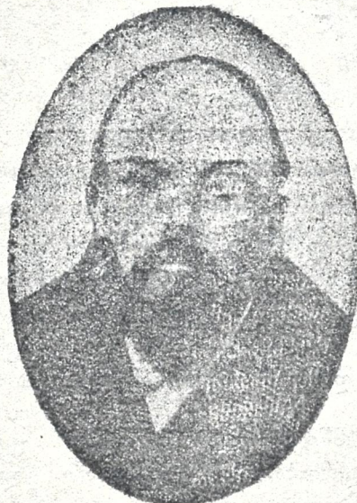
ნიკოლოზ ლენინი — ულიანოვი მეუბრავლენეთა ბოლშევიკი — სოციალდემოკრატიის ბელადი, რომელიც ამ უამათ პეტროგრადის აჯანყებას სათავეში უდგას.