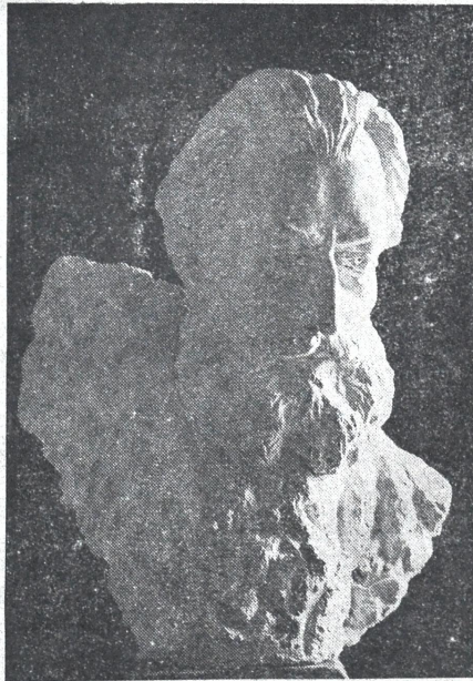
ალ. შაუშვილი (1847—1893)