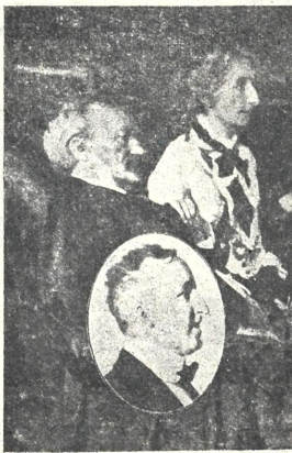
ვაგნერი, მეულერ მისი—კოზიმა და შვილი ზიგფრიდი.

(წერილი გერმანიიდან, საკუთარი კორესპონდენტისაგან)