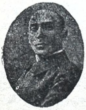
გ. შალიკა შვილი

— „იმა იქით კილომ იტყვიენ, სამართალია ქოყანაზე. სტრავს ფული მიეცი, მამასახნის და ხუცესს ჯამაგირი აძლიე, კლისი ააშენე გზაი გააკეთე, შტრაფი გადებხადე გადასახალი აძლიე, ვინცხამ ფული წვილო, იგიც შენ შეიწერიო და იმას კი არ კითხუ-