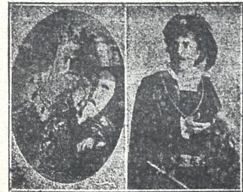
მეფე ლირი ჰამლეტი

სომეხთა მსახიობანი პ. აღამიანი როლებში (გარდ. 25 წ. შ. შესრულების გამო)