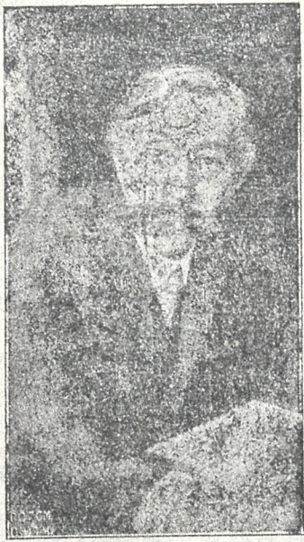
† მგოსანი ემილ ვერჰარნი

მ ი ი ღ ე ბ ა ს ე ლ ი ს მ ო წ ე რ ა დაწვრილებით იხ. მე-16-ე გვ