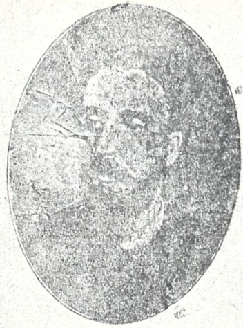
გვ. ნინოშვილი (1861—1894) მოთხრობის „მოსე მწერალი“-ს